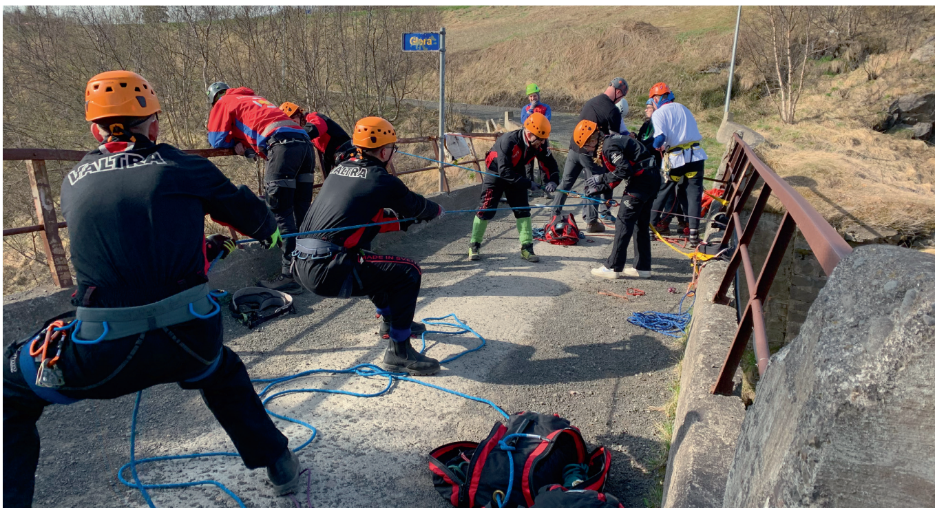
Verkefni á Glerárbrúnni.