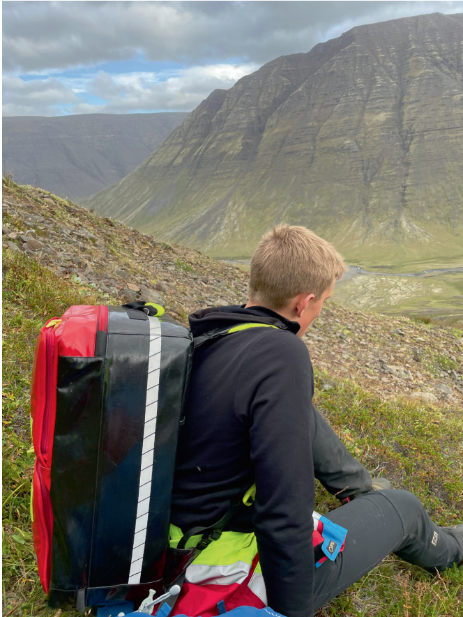
Úr útkalli 2. september.