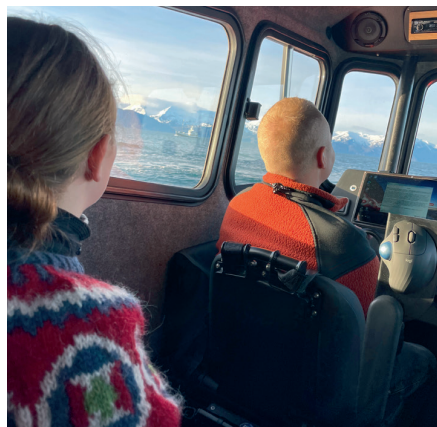
Bátsferð á Húsavík.