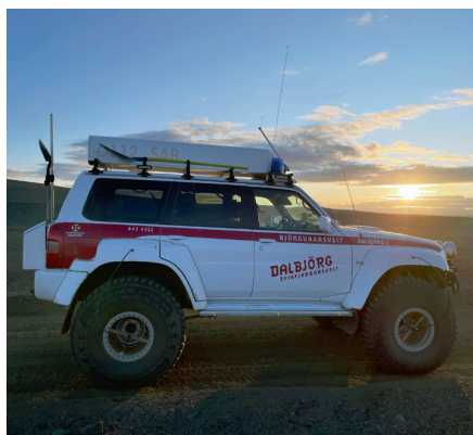
Dalbjörg 2 í Laugafelli.