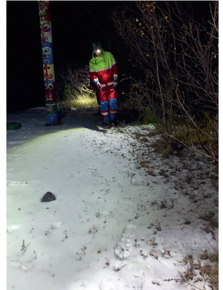
Leitaræfing í Aldísarlundi.

Almennir fundir voru haldnir mánaðarlega. Þar er til dæmis farið yfir liðna atburði, námskeið og verkefni framundan. Einnig reyna félagar sveitarinnar að hittast vikulega og gera eitthvað saman t.d. teknar æfingar og farið yfir búnað og tæki.