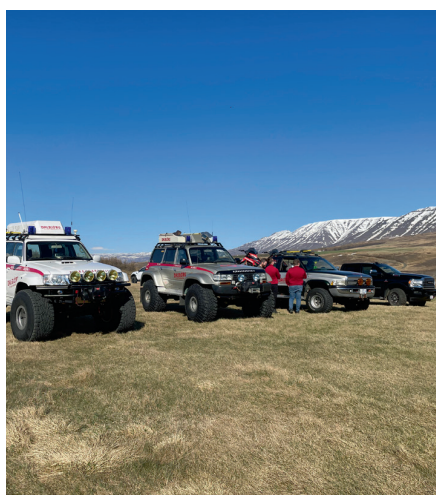
Tækin til sýnis á sumardegnum fyrsta á Melgerðismelum.