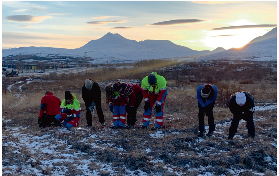
Leitað að ýmsum smáhlutum í kjarrinu.

Einnig sóttu meðlimir sveitarinnar fjarnámskeið. Sem dæmi má nefna, aðgerðagrunnur, öryggi við sjó og vötn og björgunarmaður í aðgerðum.