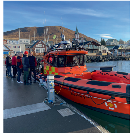
Nýji báturinn skoðaður.