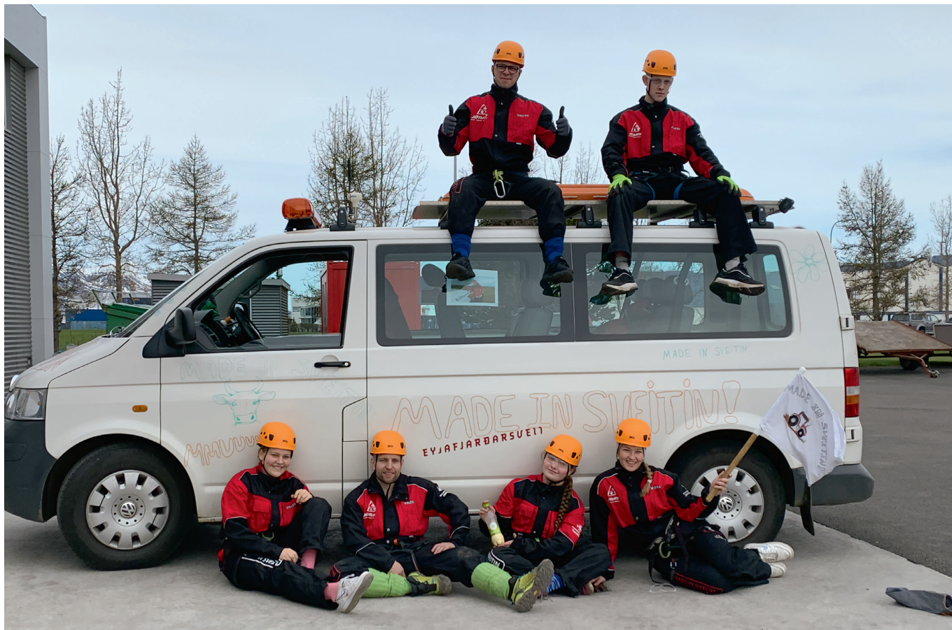
Bíllinn vel skreyttur.