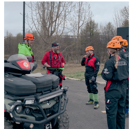
Hópurinn fær upplýsingar um næsta verkefni.