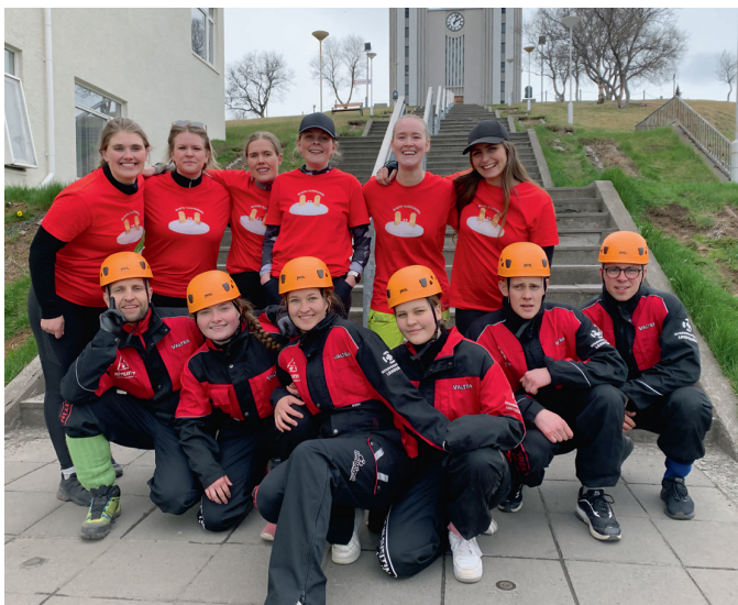
Made in sveitin með liðinu Blautu plástrum.