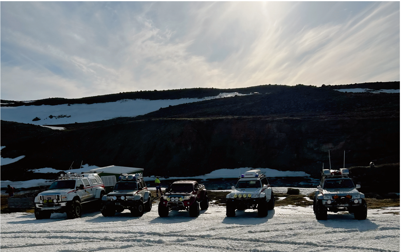
Dagsferð 29. apríl.