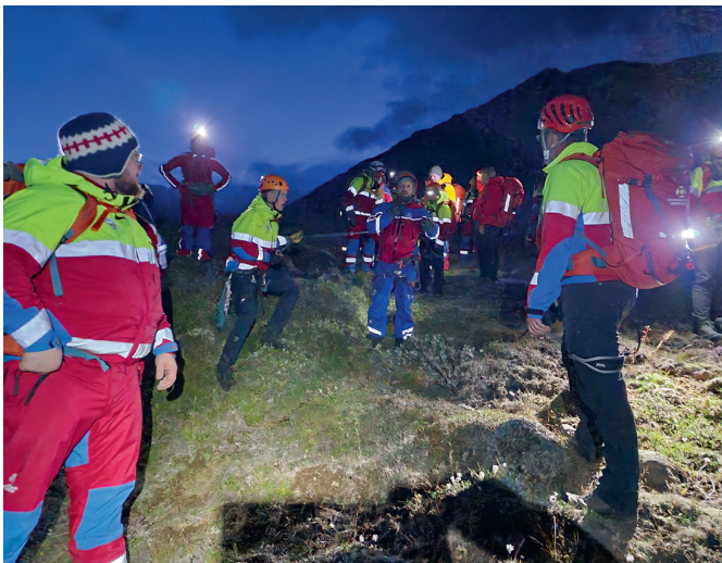
Úr útkalli 2. september.