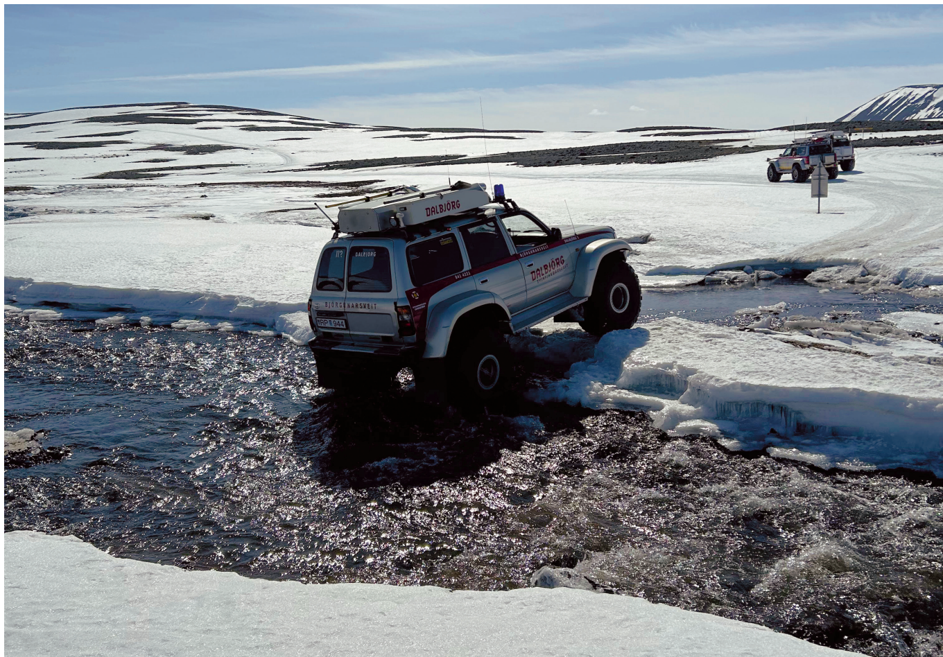
Dagsferð að miðju Íslands með félögum úr Súlum.