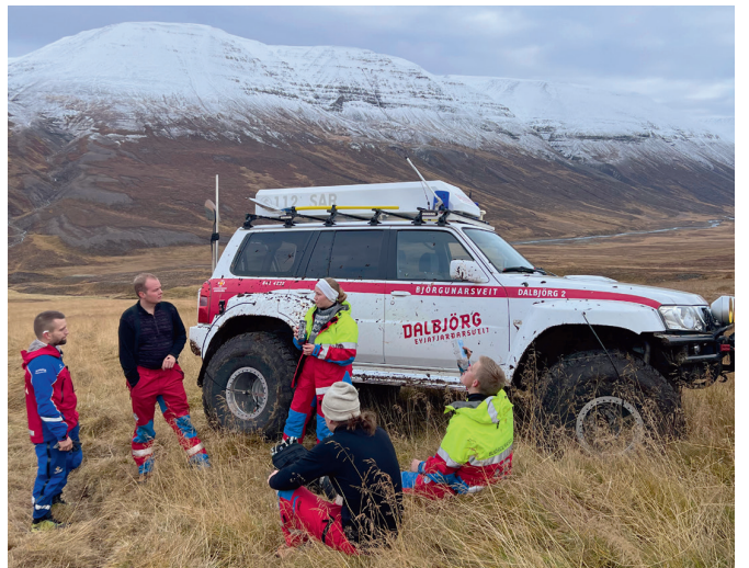
Útkall 6. október.