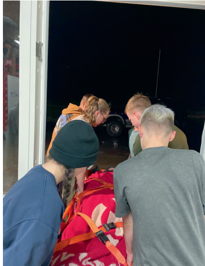
Flutningur í börum.

Í lok október fórum við í heimsókn út á Siglufjörð þar sem við hittum unglíngadeildir frá Siglufirði, Ólafsfirði, Dalvík, Svalbarðseyri og Sauðárkróki. Haldnir voru litlir björgunarleikar með 6 stöðvum: fjallabjörgun, kassaklifri, sigi, pokahlaupi, ratleik, hnútum og danskeppni. Um 80 krakkar tóku þátt í viðburðinum og tæplega 20 umsjónarmenn en það var ótrúlega gaman að fá að taka þátt í þessari stóru æfingu og kynna unglíngadeildunum í kringum okkur. Við kíktum einnig í heimsókn á Slökkvistöðina á Akureyri í lok nóvember þar sem við fengum kynningu á þeirra starfi og krakkarnir fengu að prófa reykköfunartæki og