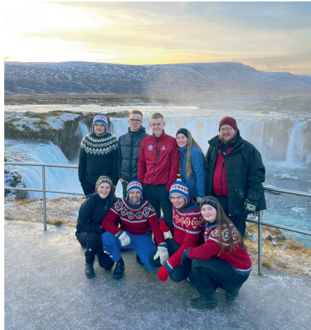
Hópurinn við Goðafoss.