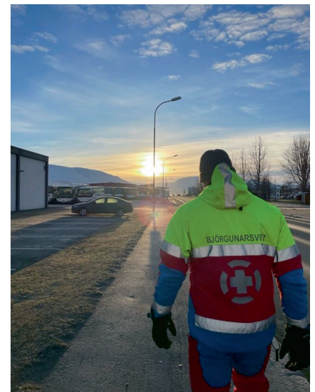
Veðrið var gott á námskeiðinu.