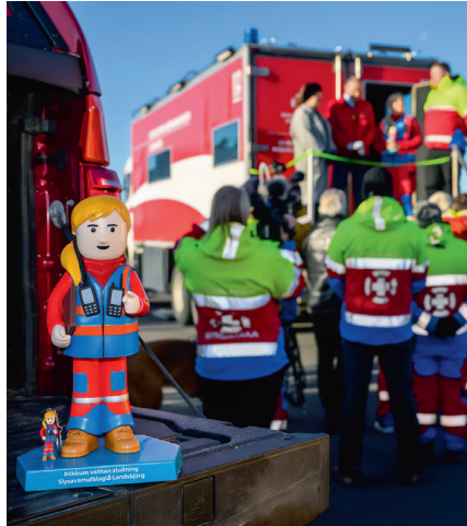
Neyðarkallinn í ár var aðgerðastjórnandi..

Síðastliðin misseri hefur orðið “aðgerðastjórnandi” heyrst æ oftast í fjölmiðlum. Hefur það einkum komið upp í sambandi við stærri aðgerðir björgunarsveita Slysavarnafélagsins Landsbjargar (SL) og núna í byrjun nóvember þegar björgunarsveitir stóðu fyrir sölu Neyðarkallsins - en í ár var hann eða réttara sagt hún einmitt aðgerðastjórnandi. Samt sem áður eru kannski margir sem velta því fyrir sér hvað aðgerðastjórnendur gera. Öll vitum við hvað hinir “Neyðarkallarnir” gera eins og t.d. kafarinn, vélsleðamaðurinn, drónakonan og skyndihjálparkonan.