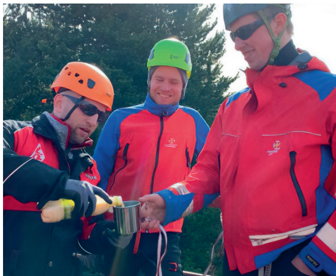
Broddur í boði Dalbjargar.