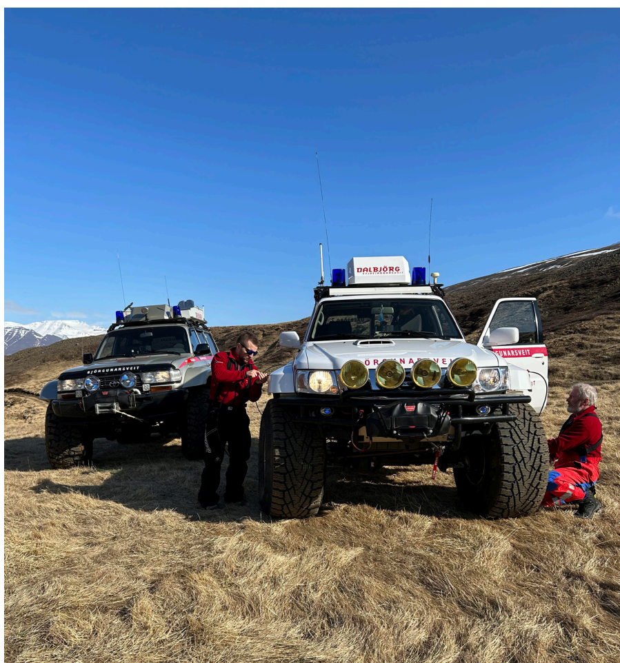
Dagsferð 29. apríl.