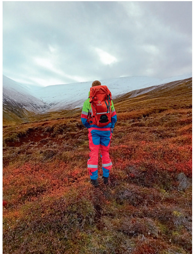
Útkall 6. október.