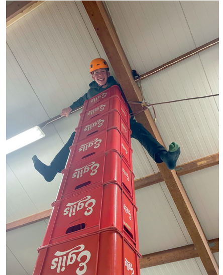
Fjör í kassaklifri.

kasta brunaslöngum ásamt því að kynnast öðrum búnaði. Í byrjun desember fórum við út á Hjalteyri í klifurvegginn hjá 600Klifur og fengum að prófa ýmsar klifurleiðir þar.