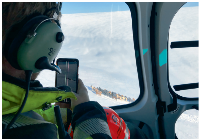
Úr þyluferð í hrossasmöln 7. október.