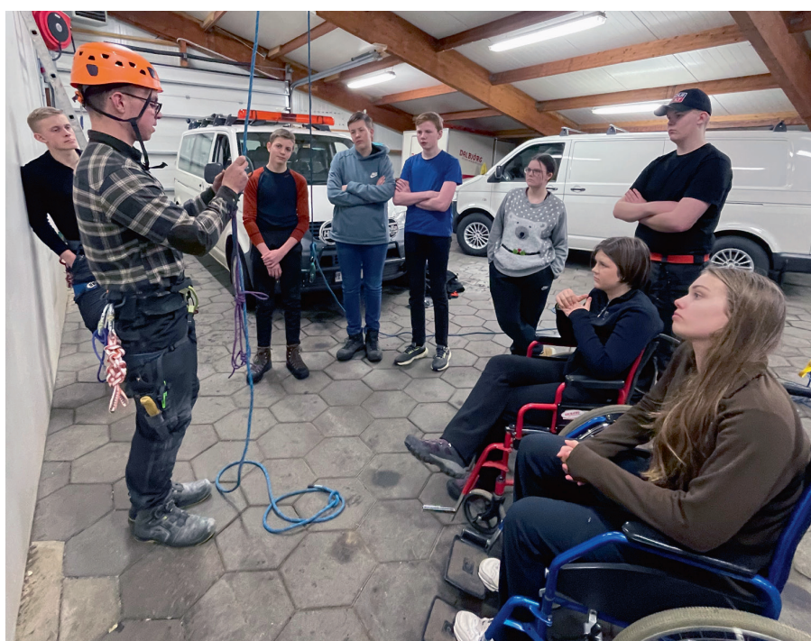
Farið yfir hvernig er júmmað.