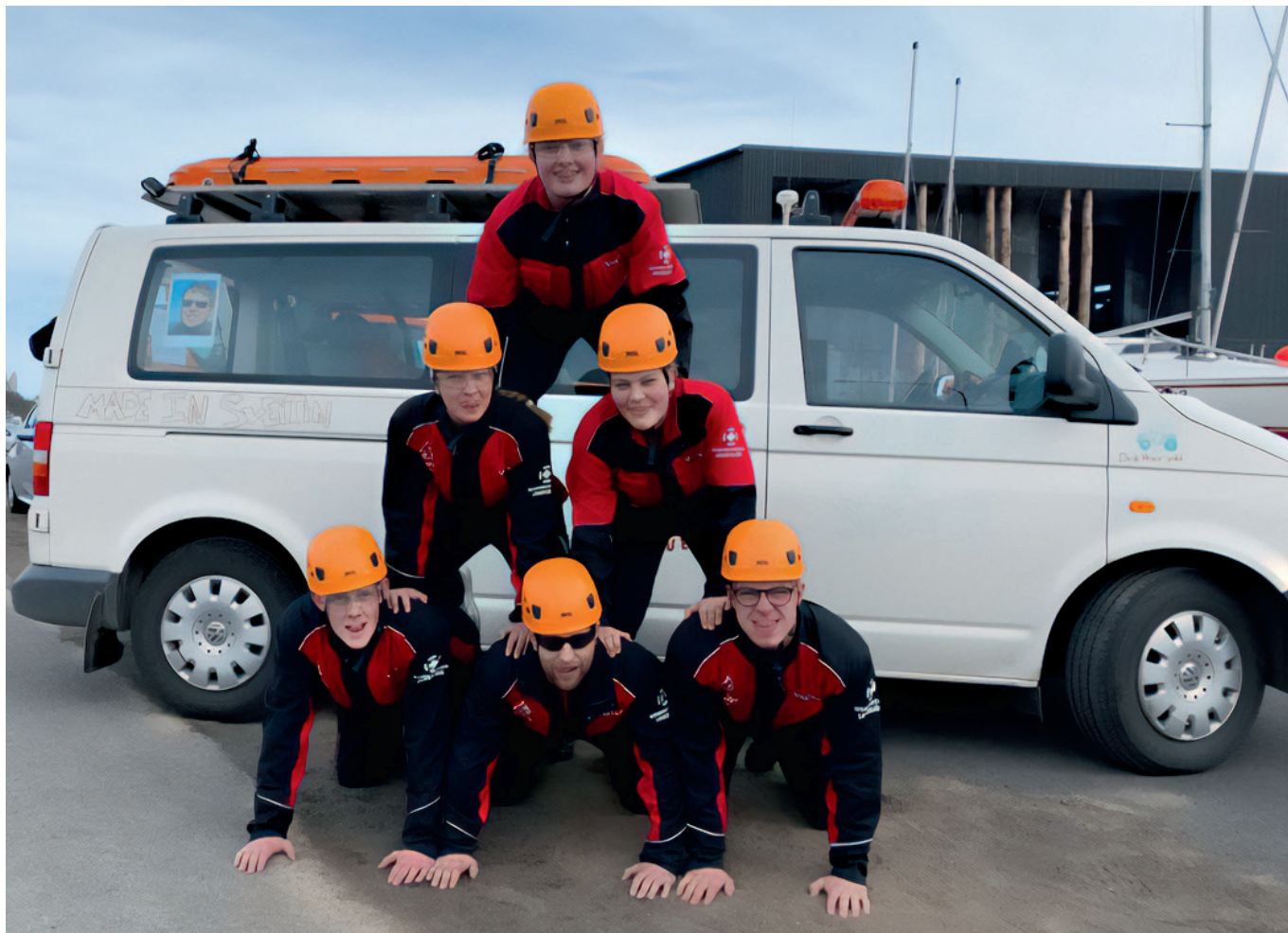
Made in sveitin liðið á góðri stundu.

Við óskum viðskiptavinum okkar gleðiríkrar jólahátíðar og farsældar á nýju ári.