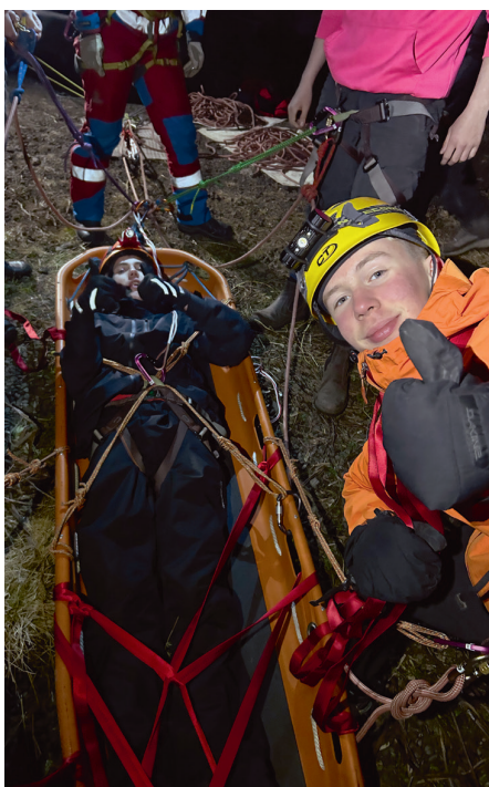
Fjallabjörgunarverkefni á Siglufirði.