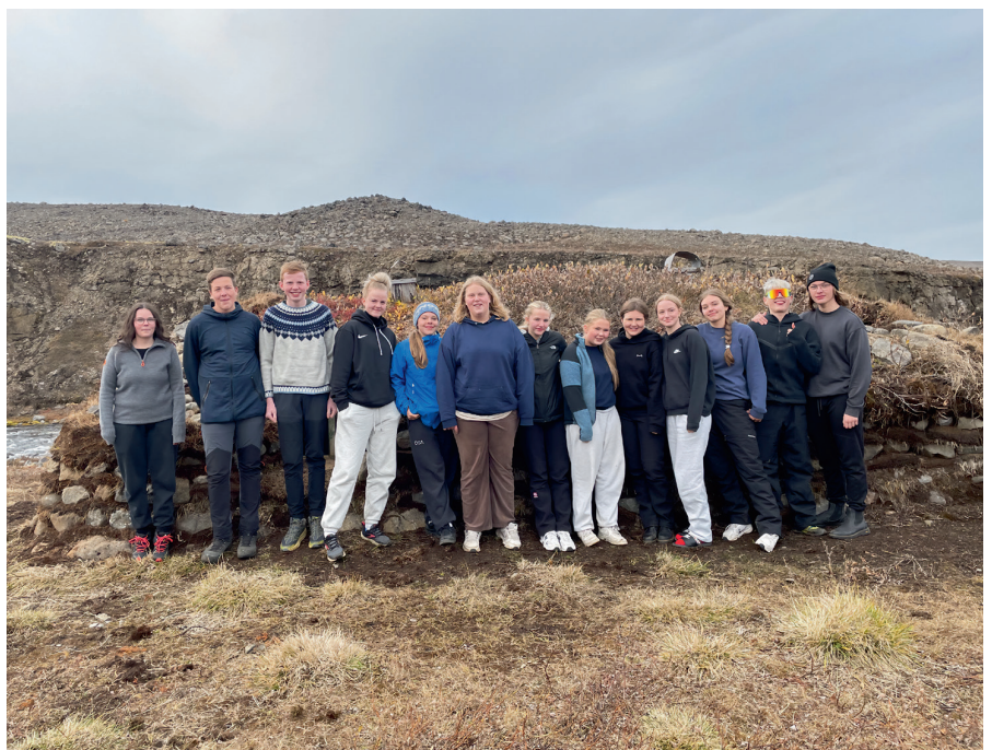
Hópurinn við Grána í unglíngadeildarferð í haust.