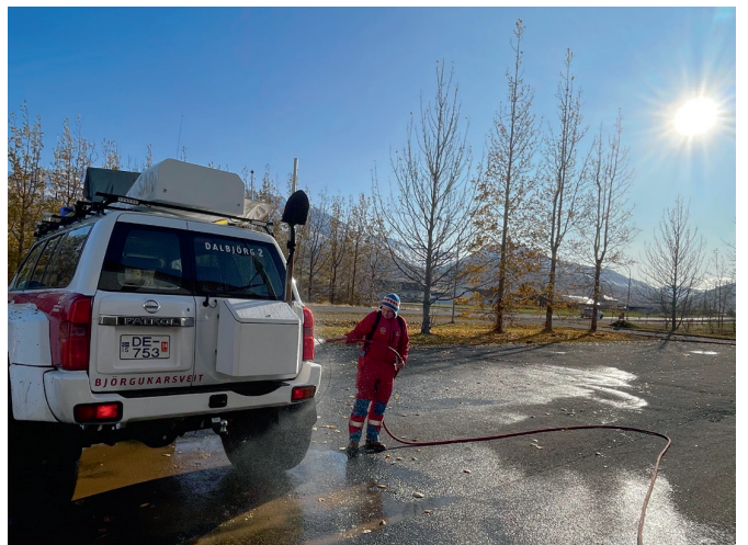
Mikilvægt að þrifa bílana eftir útköll.