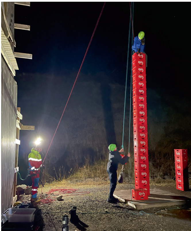
Kassaklifur á Siglufirði.