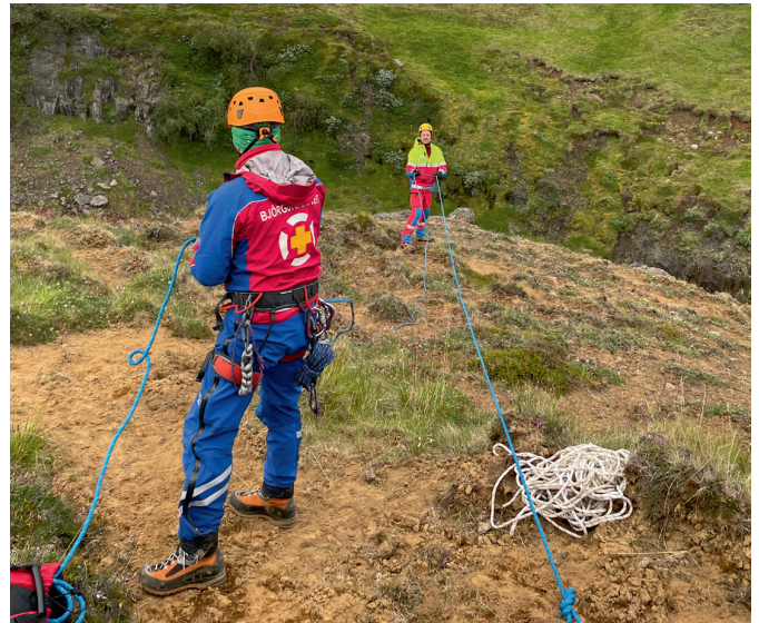
Aðstoðarbeiðni 11. júlí.

Fjórir félagar fóru þessa helgi og aðstoðuðu Grindvíkinga við lokanir vegna jarðhræringa á svæðinu.