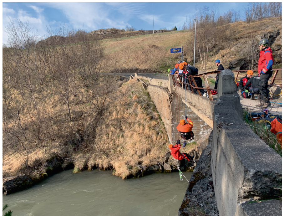
Verkefni þar sem sigið var fram af Glerárbrúnni.