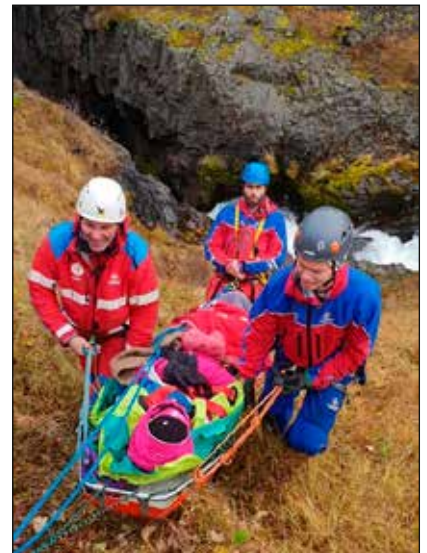
Samæfing, svæði 11.