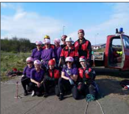
Made in Sveitin og Dívur frá Súlum á Akureyri.