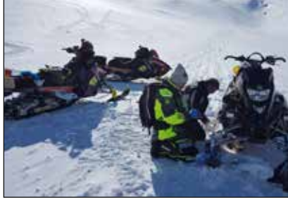
Aðstoðarbeiðni vegna bilaðs sleða á Skjöldal.