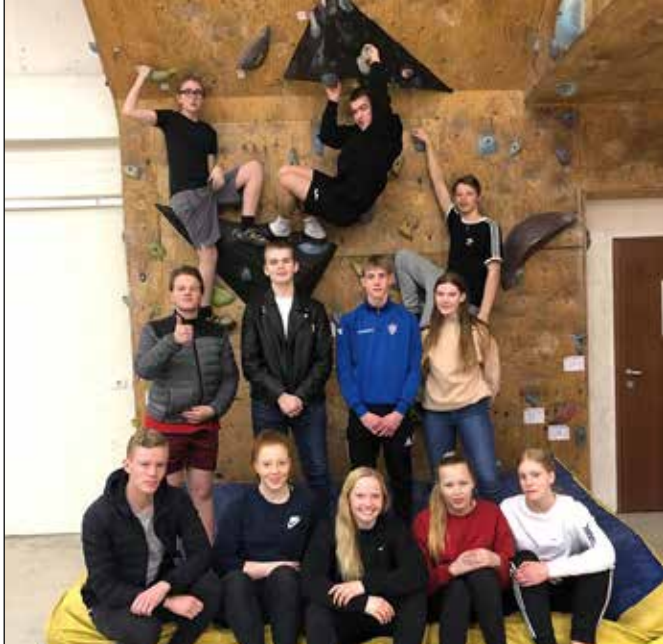
Hittingur í klifurvegnum í Súluhúsinu.