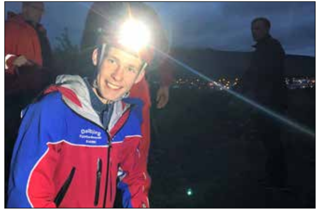
Bjarki kátur á fjallabjörgunarfingu með Súlum við Glerá.