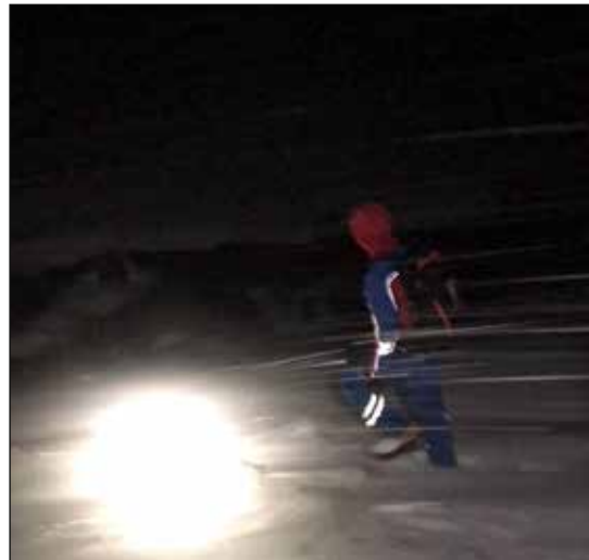
Veðrið leikur ekki alltaf við okkur í útköllum.