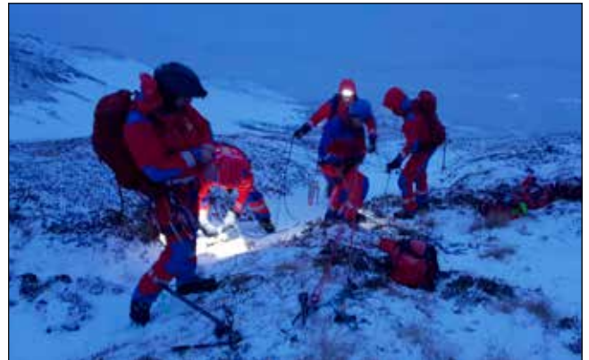
Snjóflóðaæfing í Hlíðarfalli.