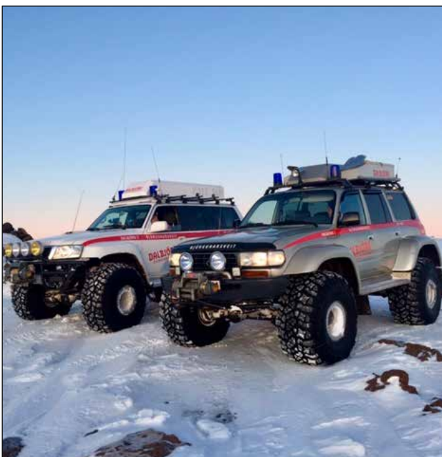
Gamlir félagar við Skólavörðu.

Annar félagi sveitarinnar í svæðisstjórn sótti aðgerðastjórnunarnámskeið þann 8. apríl. Þá sóttu þrír félagar Fjarskipti 1 á Grenivík og tveir félagar Björgunarmann í aðgerðum á Dalvík. Önnur námskeið voru tekin eftir þörfum og einnig á veraldarvefnum í fjarnámi.