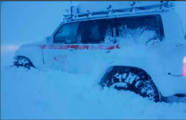
Dalbjörg 2 í stórræðum.