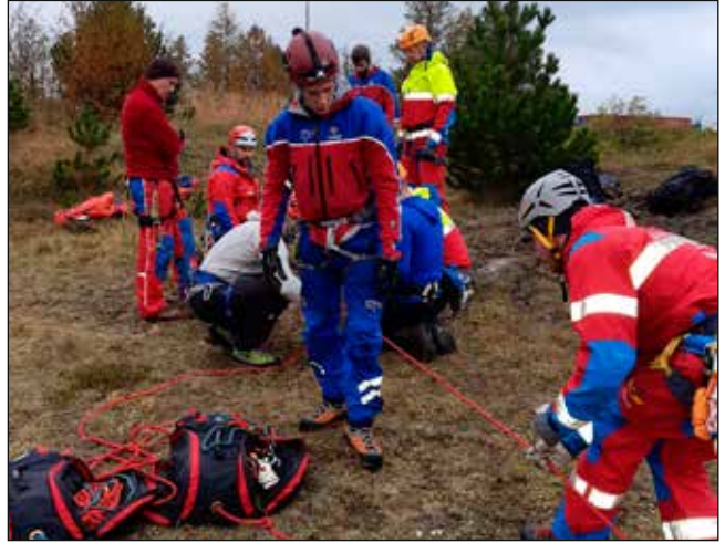
Æfing með Súlum.