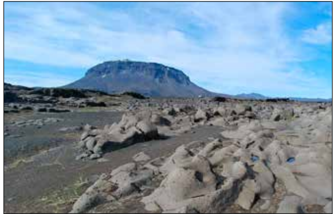
Drottningin sjálf. Hálandsvakt 2019.

Flugeldasalan fór fram með hefðbundnu sniði í Hrafnagilsskóla. Unnið var við gæslu á tjaldsvæði í júnímánuði. Vinna við Handverkshátíð hófst þann 18. júlí og stóð með hléum til 14. ágúst þegar sýningin var tekin niður, en einnig sáu Dalbjargarfélagar um sjúkragæslu á sýngunni.