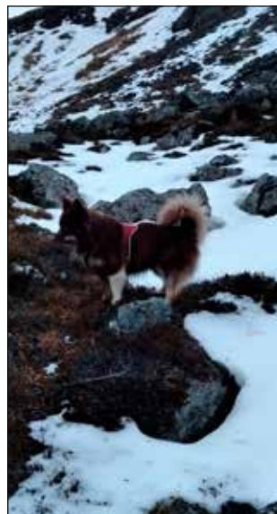
Jörundur á hundaæfingu, kominn með C-próf í snjóflóðaleit.