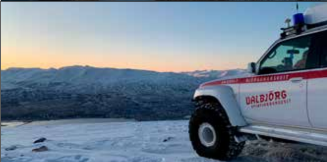
Æfingaferð á Flateyjardal.