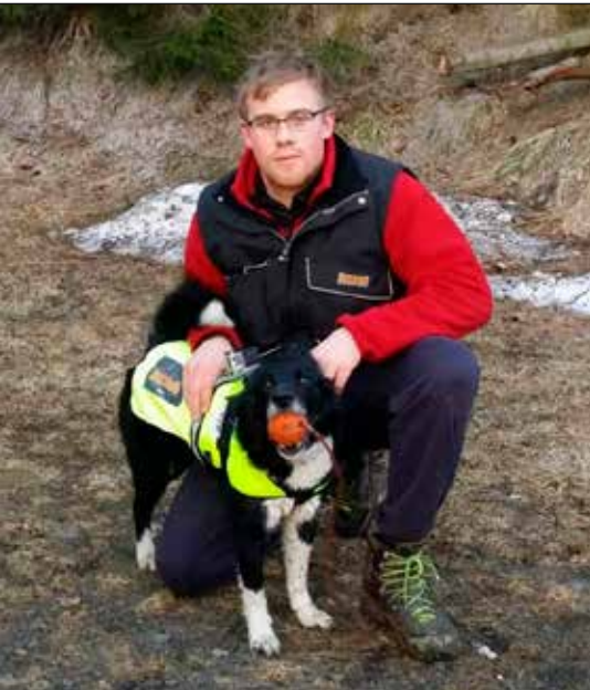
Amar Logi og Skotta.