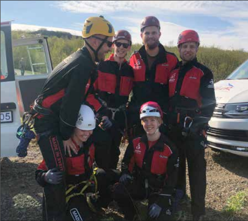
Made in Sveitin á góðri stund.

Föstudaginn 17. maí lögðu af stað í leiðangur sex sveitungar. Leiðin lá austur á Egilsstaði þar sem fram fóru Björgunarleikar SL í sól og blíðu en eru þeir haldnir annað hvert ár samhliða Landsþinginu. Á föstudagskvöldinu var grill og lopapeysustemning en á laugardeginum fóru sjálfir leikarnir fram. Áð þeim loknum var árs hátíð SL haldin í íþróttahúsinu á Egilsstöðum. Heljarinnar balli var slegið upp og skemmtum við okkur fram á nótt. Á sunnudeginum héldum við heim á leið, þreytt en afar sáttt með helgina.