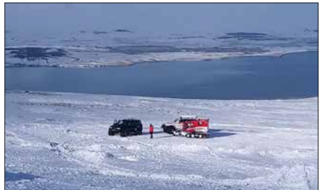
Veðrið lék við þátttakendur á hundaæfingu í Vaðlaheiði.