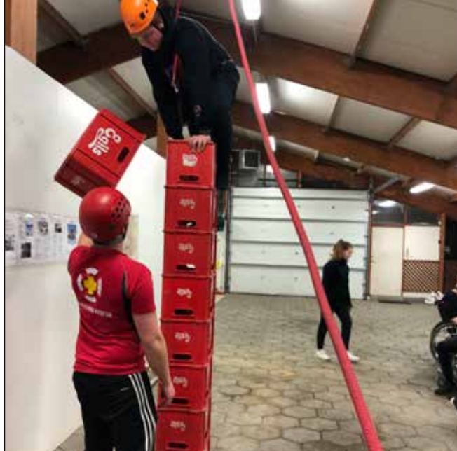
Kassaklifur hjá unglingsdeild.