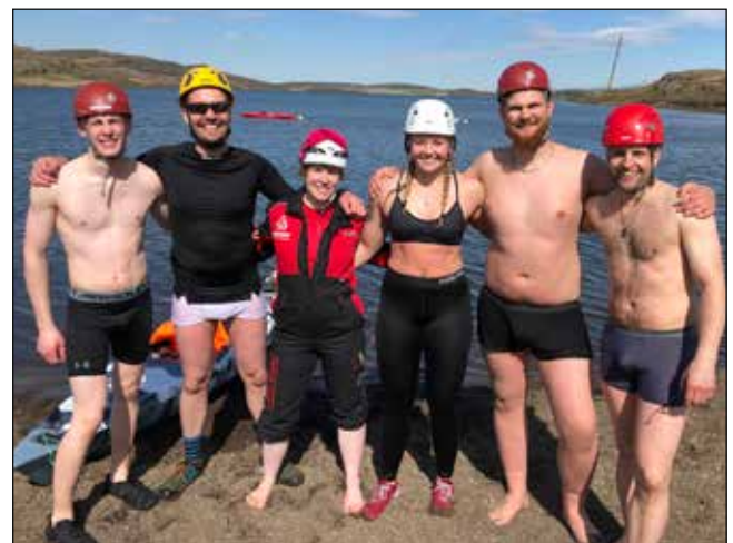
Stórskemmtilegt kajakverkefni á Urriðavatni.