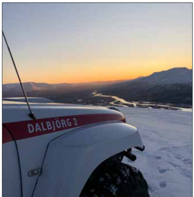
Úr haustferð Dalbjargar.