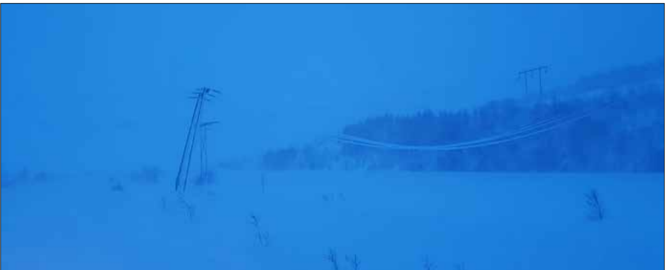
Rafmagnsstaurar við Hvamm í Eyjafjarðarsveit 13. desember.