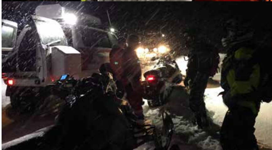
Útkall á Eyjafjarðardal 13. mars