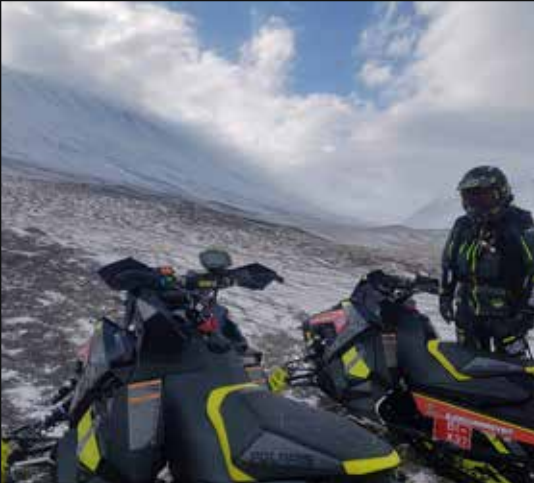
28-31 – Útkall á Sigtúnafjall.

6 og 7 fóru á Kerhólsöxl ásamt þremur sleðum frá Dalvík og einum frá Tindi, Ólafsfirði. Leitað var við Sandárgil og síðar á Sigtúnafjalli þar sem maðurinn fannst heill á húfi í tjaldi sínu. Átta manns tóku þátt í aðgerðinni frá Dalbjörg auk eins í svæðisstjórn.