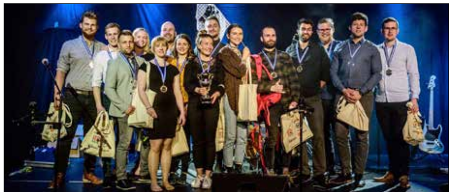
Sigurliðin á sviði.