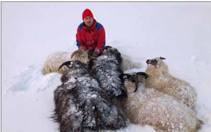
Kindum bjargað úr fönn.