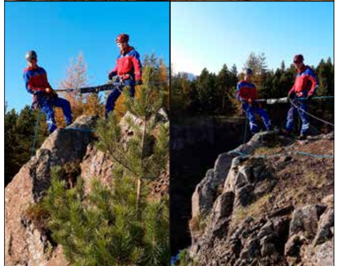
Fjallabjörgunaræfing í Reykargili.