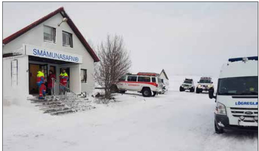
Söfnunarsvæði bjarga að Smámunasafninu í Sólgarði 13. desember.

Björgunarsveitir af öllu landinu tóku þátt í útkalli sem boðað var vegna drengs sem féll í krapaflóð í Núpá í Sölvadal, Eyjafjarðarsveit. Um var að ræða sérhæfða aðgerð þar sem að komu straumvatnsbjörgunarmenn, sérhæft leitarlið, þyrila Landhelgisgæslunnar og fleiri bjargir. Þá aðstoðuðu heimamenn við snjómokstur, flutninga og leiðarlýsingar við skipulagningu aðgerðarinnar ásamt því að sjá um mat og aðstöðu fyrir björgunarfólk ásamt teymi frá Rauða krossinum. Drengurinn fannst látinn eftir hádegi þann 13. desember. Hjálparveitin Dalbjörg vottar aðstandendum samúð sína.