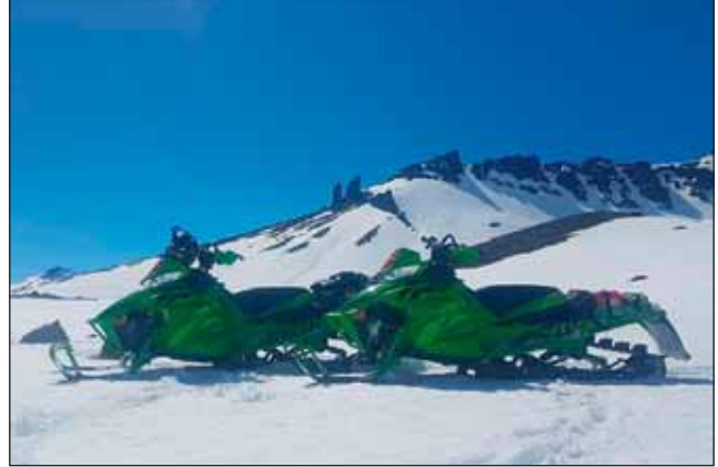
Úr æfingaferð 31. maí á Arctic Cat sleðunum.