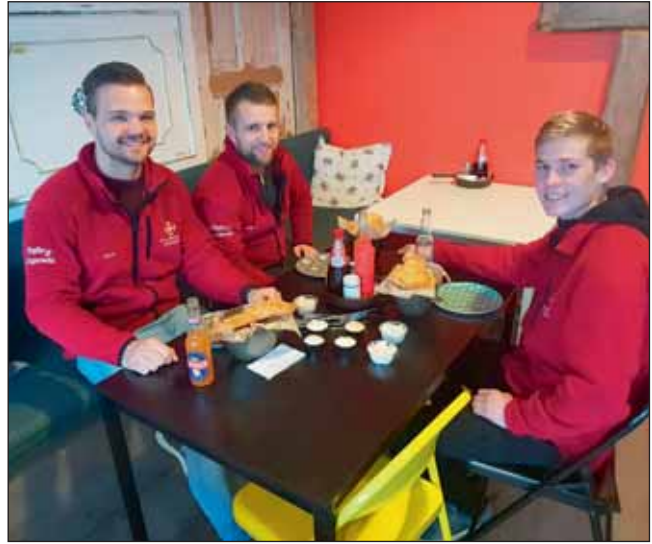
Þrír félagar að snæðingi á Akureyri Fish and Chips.