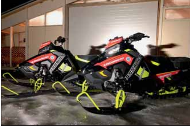
Nýju Polaris sleðarnir.

deildinni berum miklar vonir til þess að þessir sleðar muni reynast okkur vel. Nú tekur við vinna hjá sleðadeild að gera sleðana útkallshæfa en þar má helst nefna að bæta þarf á þá staðsetningar- og fjarskiptabúnaði, auk nauðsynlegs farangurs og bensínbrúsa.