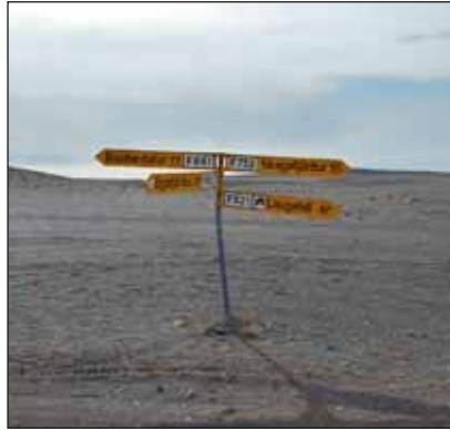
... „Vegir liggja til allra átta...“

Strax fyrsta kvöldið kom aðstoðarbeiðni vegna rútu sem var kolföst inn við Sveinstind.