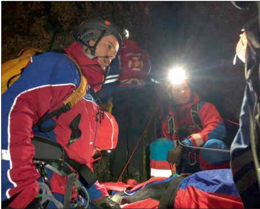
Æfingin komin af stað.