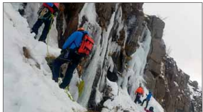
Námskeið í Fjallamennsku 2.