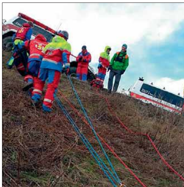
Björgunarmenn að störfum.