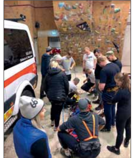
Æfing í H12 fyrir samæfingu.