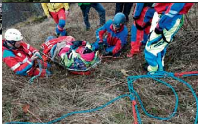
Sjúklingur tilbúinn til flutnings.