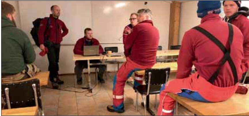
Fundur í Dalborg fyrir samæfingu.