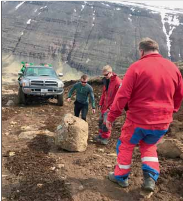
Færa þurfti hindrun af Vatnahjallavegi eftir vorleysingar.

Sveitinni barst útkall vegna fólksbíls sem var fastur á leið fram Eyjafjarðardalinn. Tveir voru um borð í bílnum. Tveir félagar lögðu af stað til að bjarga mönnum en var þeim snúið við þar sem mennirnir höfðu fengið far með vel búnum bíl til byggða.