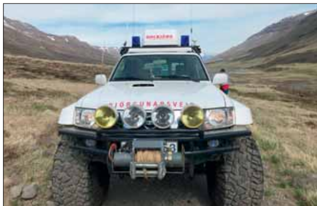
Patrol á leið í útkall inn á Eyjafjarðardal 4. júní.

Bestu óskir um glæðileg jól og farsælt nýtt ár