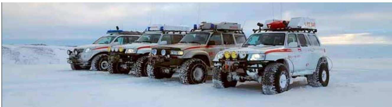
Tækjakostur björgunarsveita er glæsilegur.