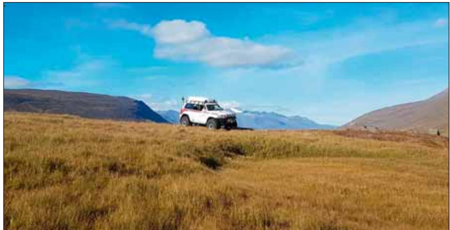
Patrol inn á Æsustaðatungum að sækja slasaðan gangnamann 6. september.

Aðstoðarbeiðni í Sölvadal. Fjórir félagar fóru á Dalbjörg 1 til aðstoðar rjúpnaskyttu ofan Þormóðsstaða þar sem þar sem hann hafði komist í sjálfheldu á bíl sínum. Verkefnið var leyst í góðu veðri