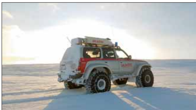
Æfingaferð 20. janúar.

Almennir fundir voru 11 talsins og stjórnarfundir einnig. Aðrir fundir voru haldnir eftir þörfum, s.s. í sleðahóp, tækjahóp og fjallabjörgun- arhóp, m.a. í tilefni af Bakvarðaæfingu sem haldin var þann 21. september. Þá héldum við áfram vikulegum fundum sem byrjað var að halda árið 2017, en þeir kallast einmitt „Vikulegir“, og eru haldnir á mánudögum. Að venju voru haldin fjölmörg vinnukvöld á árinu, vegna vinnu í húsi, tækjum og fleiru.