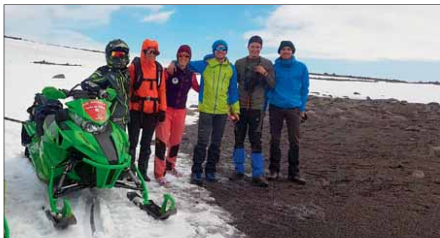
Útkall 4. júní.

Útkall barst vegna neyðarboðs frá neyðarsendi í flugvél. Sex manns fóru af stað á tveimur bílum, en í ljós kom að ekki reyndist hætta á ferðum.