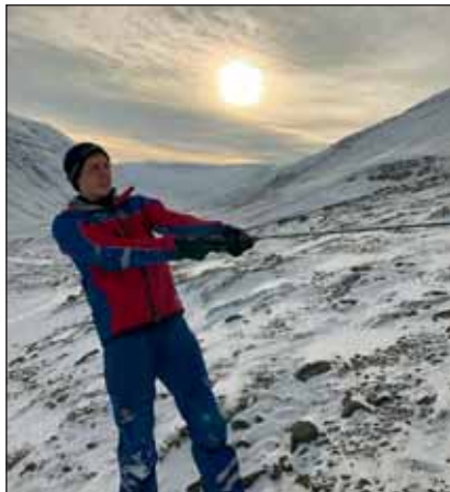
Þjarki í útkalli 27. október.

Útkall barst vegna fjórhjólasyss við Kiðagil á Sprengisandsleið. Ellefu manns mættu í hús og biðu frekari fyrirmæla, en ekki reyndist þörf á okkar mannskap að þessu sinni.