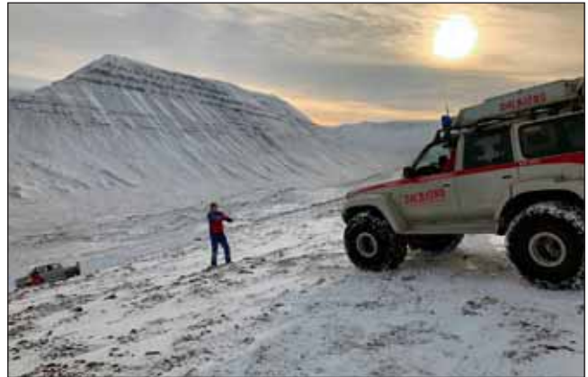
Útkall 27. október inn á Sölvadal.

að hafa sig aftur á bak og kom til móts við björgunarmenn. Um tveimur tímum síðar, þegar hlúð hafði verið að konunni, var hún flutt með sjúkrabíl til byggða þar sem hún fór til frekari skoðunar.