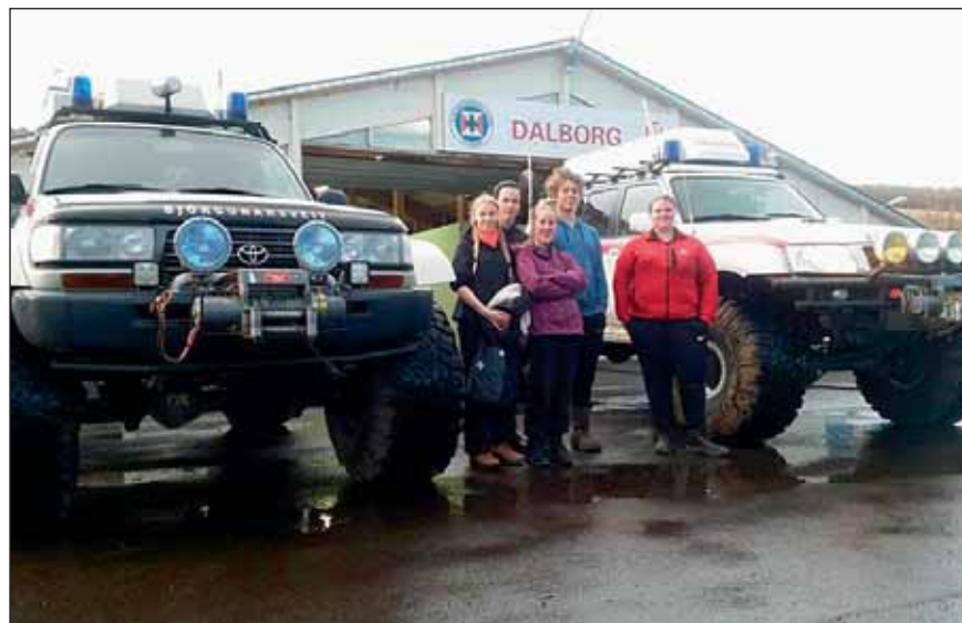
Hópurinn eftir jeppaskreppuna ásamt umsjónarmanni.

Eftir áramót fórum við í heldur tæknilegri hluti tengda björgunarsveitastörfum. Við héld-