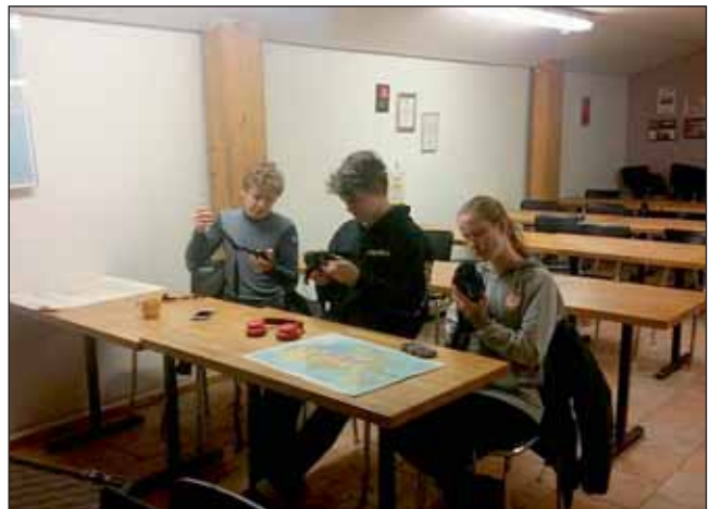
Krakkarnir að stúdera snjóflóðayfli.