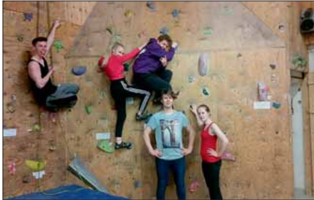
Hópmýnd í klifurvegnum í H12.

Við hittumst nokkrum sinnum fyrir jól en á