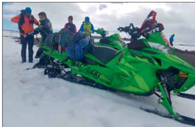
Útkall 4. júní