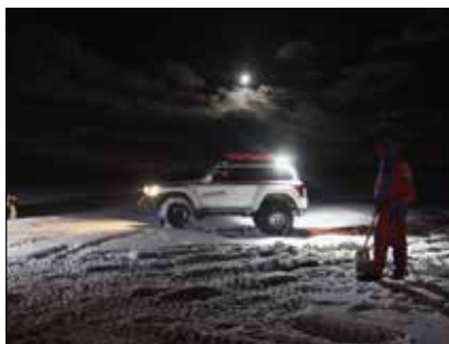
Dalbjörg 2 í tunglsljósínu.