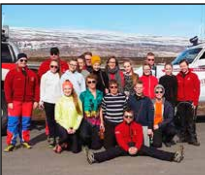
Jeppaferð vorid 2015.