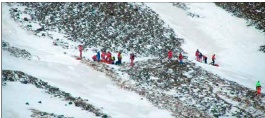
Björgunarmenn að störfum á slysstað.

Unnið var í því að búa um Halla í börunum og var kominn á staðinn fjallabjörgunarahópur frá Súlum sem setti upp línur svo við gætum komið börunum neðar í hlíðina á öruggan hátt.