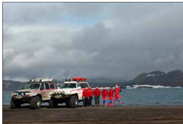
Dalbjargarfélagar við Litlasjó í Veiðivötnum.