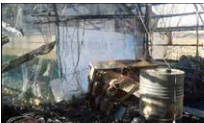
Eftir eldsvoða í Brúnalaug 18. mars.

Dalbjörg barst útkall um kl. 3:30 aðfaranótt 18. mars vegna eldsvoða að Brúnalaug í Eyjafjarðarsveit. Nokkrir Dalbjargarfélagar fóru á staðinn til aðstoðar, m.a. til að loka götum á húsum o.fl. Eldurinn kviknaði í tengibyggingu við gróðurhús og varð af mikið tjón, en ný uppskera var á leið í verslanir nokkrum dögum síðar. Rafmagn fór einnig af í eldsvoðanum.