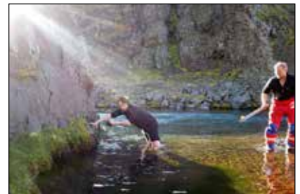
Áin vaðin til að ná snjóflóðaylinum sem leitað var að.