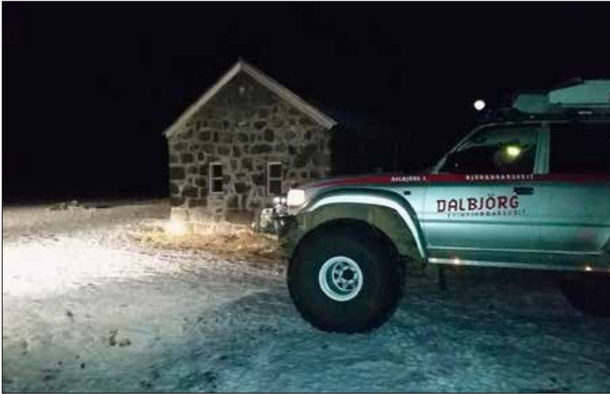
Dalbjörg 1 við sæluhúsið við Jökulsá á Fjöllum.