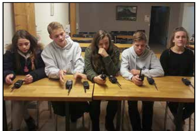
Talstöðvakennsla hjá unglingsdeild.

Bestu óskir um gledileg jól og farsælt nýtt ár Deloitte.