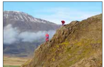
Snjóflóðaylaleit í blíðskaparveðri.