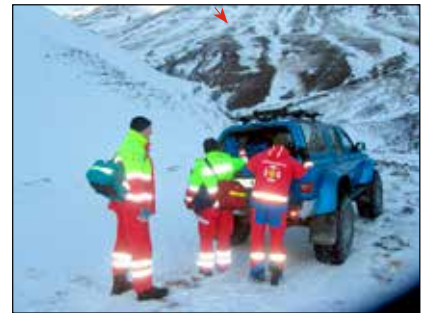
Björgunarmenn niðri í dalnum. Efst fyrir miðri mynd má sjá rauða ör sem bendir á slysstaðinn.