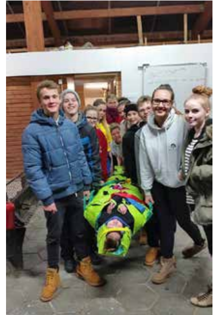
Æfing með grjónadýnu í Dalborg.

Þar sem síðasti vetur heppnaðist vel höfum við ákveðið að hafa þetta með svipuðu móti í vetur, en starfið er þegar komið af stað og er hópurinn mjög flottur og áhugasamur.