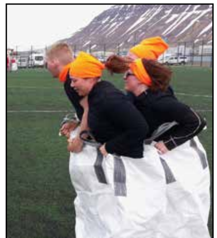
Allt að gerast í pokahlaupinu.