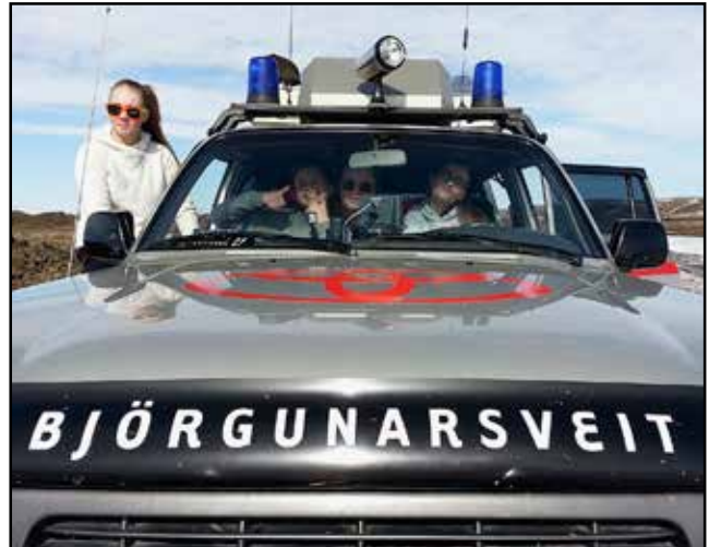
Jeppaferð vorið 2015.

Eins og síðustu ár þá endaði starfið með frábærri jeppaferð sem