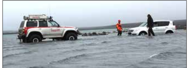
Holuhraun í mars 2015.