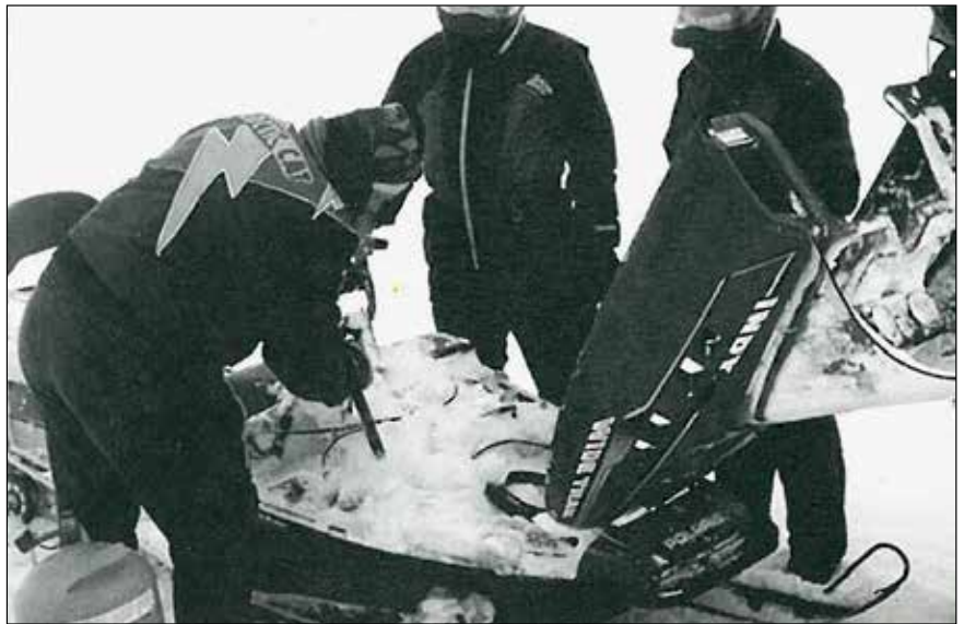
Þegar tækifæri gafst var farið upp á Nýjabæjarfjall til að ná í vélsleða Dalvíkinganna sem þurfti að skilja eftir.