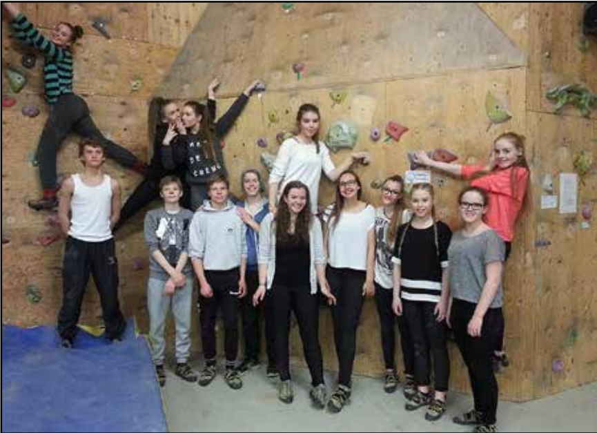
Klifurveggurinn hjá Súlum.