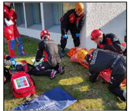
Made in sveitin í fyrstu hjálpar-verkefni.

enn í gangi og ekki síðri skemmtun, þar sem formannskjör og kjör til stjórnar voru æsispennandi.