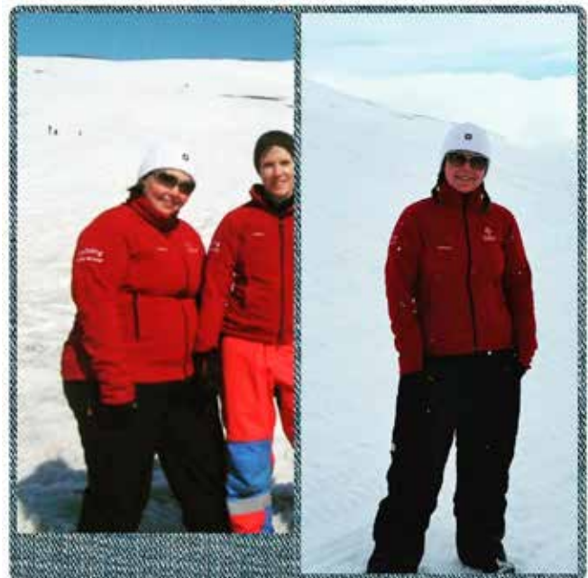
Gulla á fjölskyldudegi Dalbjargar 2014 og 2015.

Bestu óskir um gleðileg jól og farsælt nýtt ár