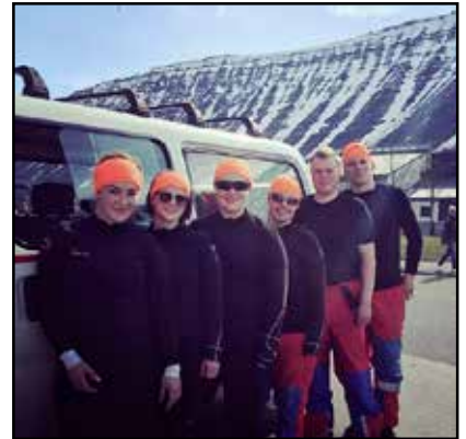
Team Skítsaama í sólinni á Ísafirði.