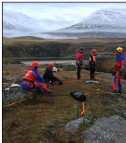
Kerfi sett upp við Munkaþverárgilið.