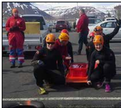
Team Skítsaama klár í þrautabratu.