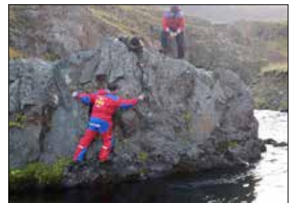
Snjóflóðaylaleit ofan Hríshóls og Stekkjarflata. Margt lagt á sig til að finna snjóflóðaylinn.