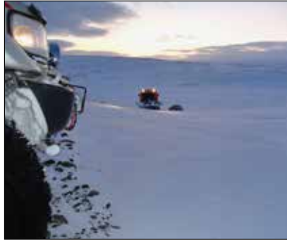
Útkall við Laugafell 1. febrúar.

Að kvöldi sunnudagsins 1. febrúar barst aðstoðarbeiðni frá lögreglu vegna ferðalanga sem voru í vandræðum austan við Laugafell. Þar voru á ferð sjö manns á þremur bílum og fóru fjórir Dalbjargarfélagar af stað til aðstoðar. Þegar beiðnin barst var almennur fundur í Dalborg svo nægur mannskapur var til að manna bílana sem fóru af stað, sem og til að undirbúa ferðina. Tveir bílar frá Dalbjörg fóru af stað og freistuðu þess að komast upp Kerhólsöxl