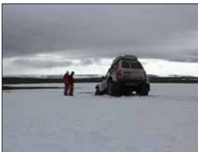
Dalbjörg 1 kominn í smá vandræði.

Frá Fjallaskarði fórum við á sunnudagsmorgni í Kárahnjúka og skoðuðum stífluna og tóku sumir skokk þar yfir. Eftir smá stopp á Kárahnjúkum var kominn tími til að halda heim og fórum við Bessastaðabrekkurnar niður í