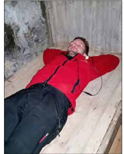
Formaðurinn að leggja sig í sæluhúsinu við Jökulsá á Fjöllum.