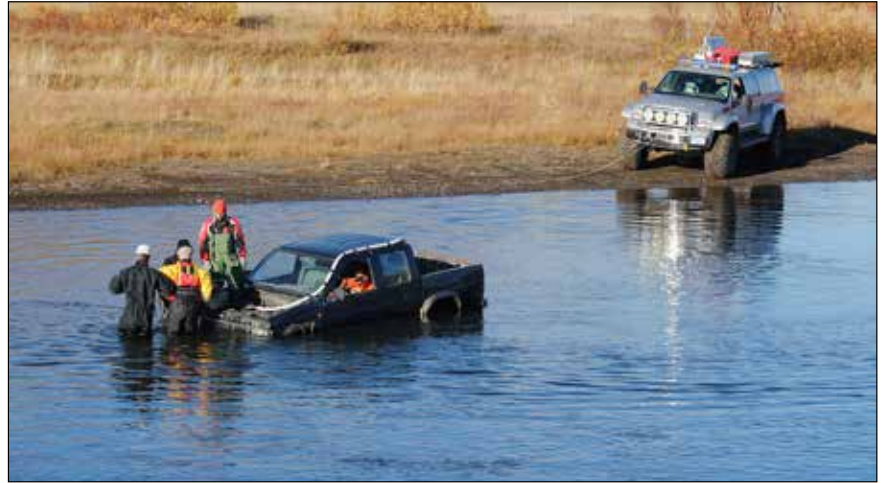
Verkefni við Eyjafjarðará, undirbúningur við að spila bílinn upp.

Æfingin öll teygði sig býsna langt, eða frá Hörgárdal til Húsavíkur. Alls voru 72 verkefni af öllum toga, s.s. fjallabjörgun, sérhæfð skyndihjálpar, bátaverkefni og einfaldlega allt sem viðkemur leit og björgun. Þessi æfing var mjög vel sótt og tókst með miklum ágætum. En