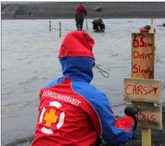
Eitt nauðsynlegra verka var að halda skiltum í lagi.