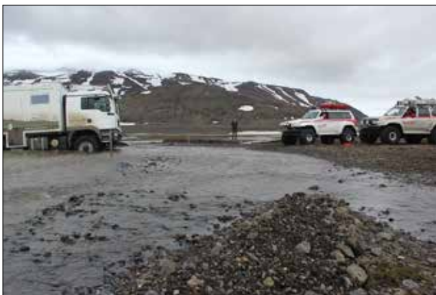
Nokkurra milljóna króna trukkur dreginn á land.