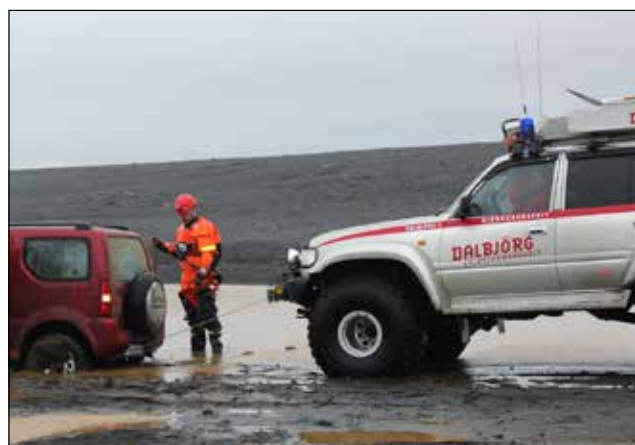
Aðstoð við ferðamenn.