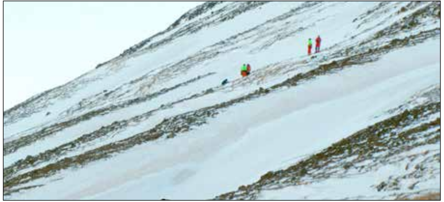
Björgunarmenn á leið að slysstað með búnað.