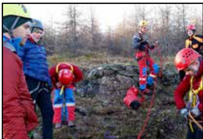
Hópurinn að gera sig kláran við Reykárگیل.