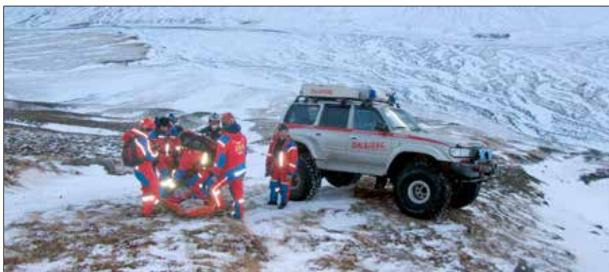
Félagar Dalbjargar og Súlna við Dalbjörg 1.