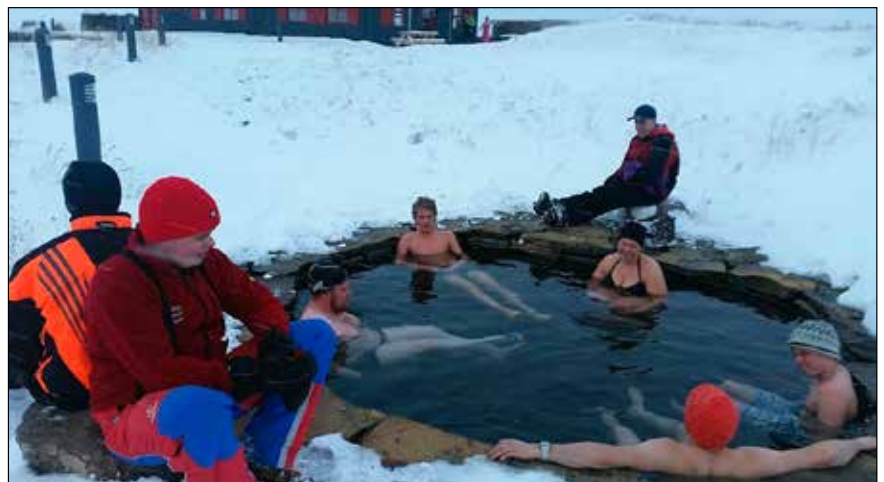
Farið var í laugina við Laugarfell fyrir austan.

Fljótsdal og komum við hjá Björgunarsveitinni Héraði á Egilsstöðum og fengum að skoða aðstöðuna þeirra sem var hin glæsilegasta. Á leiðinni heim í Eyjafjörðinn frá Egilsstöðum var tekið eitt stöpp í Hrossaborgum, enda voru nokkrir í hópnum sem höfðu aldrei komið þangað. Við renndum svo í hlað við Dalborg um 20:30 á sunnudagskvöldi, þreytt en sátst eftir góða ferð.