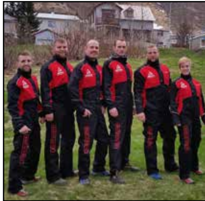
Made in sveitin tilbúin í slaginn. Jötunn vélar styrktu liðið um þessa flottu galla.

Á meðan leikarnir fóru fram var Landsþingið