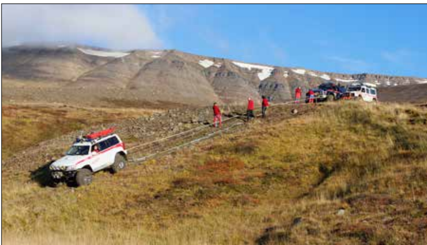
Verkefni í Sölvadal.