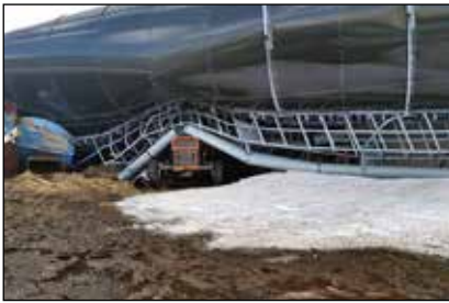
Útkall á Sigtúnum 14. mars. Súrheysturninn fallinn, en þarna undir sést gamall Massey Ferguson 135.

og lent á hluta af hlöðu á bænum. Sem betur fer slösuðust hvorki menn né dýr, en hlaðan skemmdist talsvert.