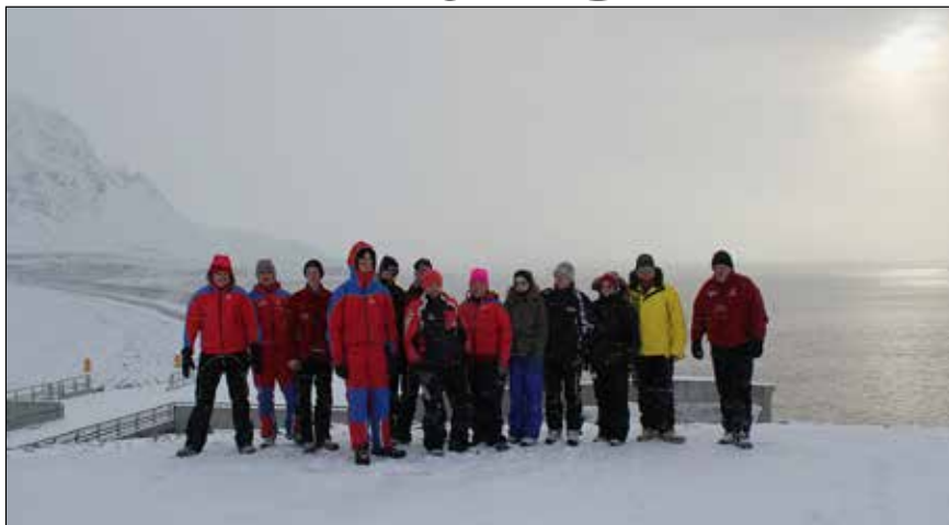
Hópurinn úr haustferðinni við Kárahnjúkastíflu.

Á laugardeginum ókum við frá Snæfellsskála og skoðuðum okkur um í nágrenni hans. Færið var aðeins betra en kvöldið áður og veðrið var