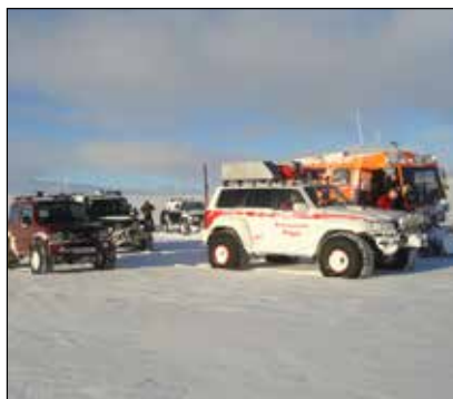
Útkall við Laugafell 1. febrúar.

í Sölvadal, en snjóbíll frá Súlum fór upp á hálandið frá Öxnadalshéiðinni. Bílar Dalbjargar lögðu af stað um kl. 23:00 og sóttist ferðin hægt upp öxlina, en um kl. 03:00 um nóttina kom upp bílur í öðrum bílum. Þá var ákveðið að hinn Dalbjargarbíllinn færi upp Bárðardal með þrjá féлага innanborðs, ásamt bílum frá Súlum og Þingey. Lagt var af stað frá Mýri í Bárðardal um kl. 06:00. Snjóbíll Súlna kom að fólkinu um kl. 7:30 að morgni 2. febrúar og bílarnir sem fóru upp úr Bárðardalnum í kjölfarið. Hugað var að fólkinu sem var við góða heilsu og hafði hafst við í bílum um nóttina. Síðan var lagt af stað aftur til byggða, en einn bíllinn þurfti að draga sökum bilunar. Farið var af stað um kl. 10 og sóttist ferðin seint. Komið var niður í Bárðardalinn á milli 18 og 19 og komu seinustu björgunarmenn til Akureyrar um kl. 20:40, um sólarhring eftir að aðstoðarbeiðnin barst. Við komuna í H12, húsnæði Súlna á Akureyri, beið heitur matur eftir mannskapnum, en það var vel þegið eftir langa törn.