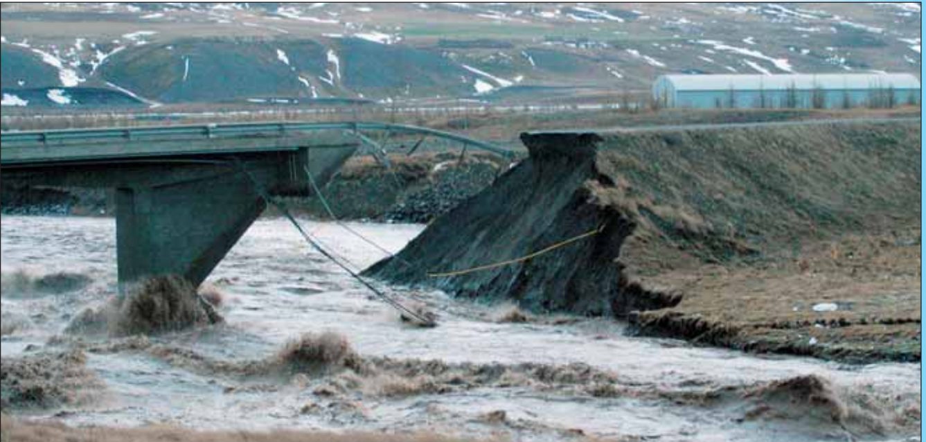
Brúin yfir Djúpadalsá.

Hjálparsvéitin, slökkvilið og lögregla fengu tilkynningu um að bíll hefði lent fram af brúnni og niður í beljandi ána. Þegar hjálparsvéitarmenn og lögregla mættu á staðinn höfðu maðurinn og hundur hans á óskiljanlegan hátt náð að komast upp úr ánni. Var hann lítilega skrámaður en mjög kaldur og þrekaður. Var hann fluttur með sjúkrahúsið á Akureyri. Bíllinn sem var stór Ford pallbíll og 6 tónna grafa sem var á kerru aftan í honum hafði áin tekið með sér og sást ekkert í tækin fyrr en sjattnaði í ánni.