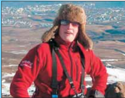
Viðar í fullum herklæðum.