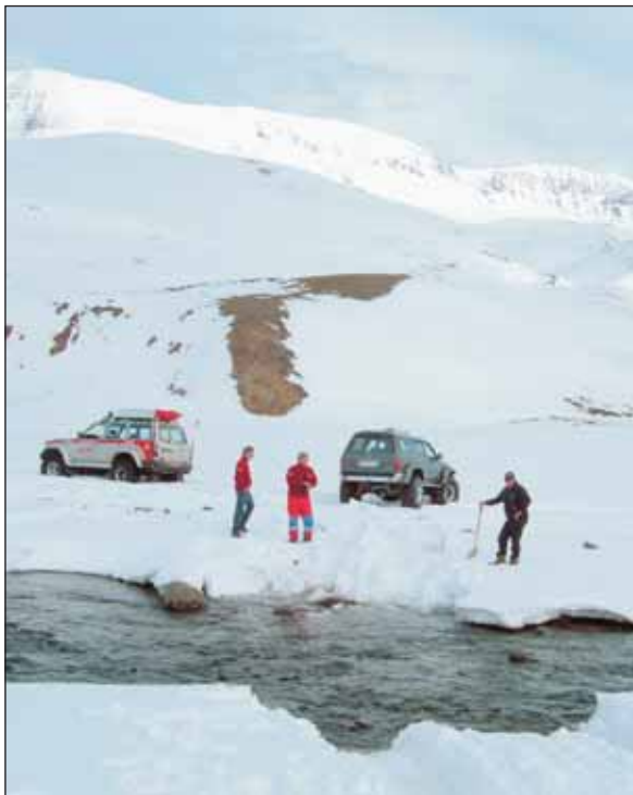
Dalbjargarmenn á ferðinni.

Morguninn eftir vaknaði fólk snemma, tók til í skálanum og síðan lá leið okkar í Arnardal. Þar voru margar uppsprettur og við lá að heilu árnar spryttu þarna upp undan jörðinni. Eftir það var farið að Hafrahvammagili og gengum við niður að gilsbrún en vakti það mikla hrifningu hópsins vegna stórbrotinnar náttúruvegurda. Því næst var ákveðið að renna upp að Háslóni og landsvæðið sem senn endar undir vatni skoðað. Þá var rennt inn að Hveragili sem er undir Brúarjökli norðan til á Vatnajökli. Þar fór færið að þyngjast sökum fannfergis og áttu minni bílar í dálitlum erfiðleikum. Dálítill vonbrigði urðu í hópnun þegar þangað var komið sökum skyggis en hópurinn hafði áætlað að labba inn