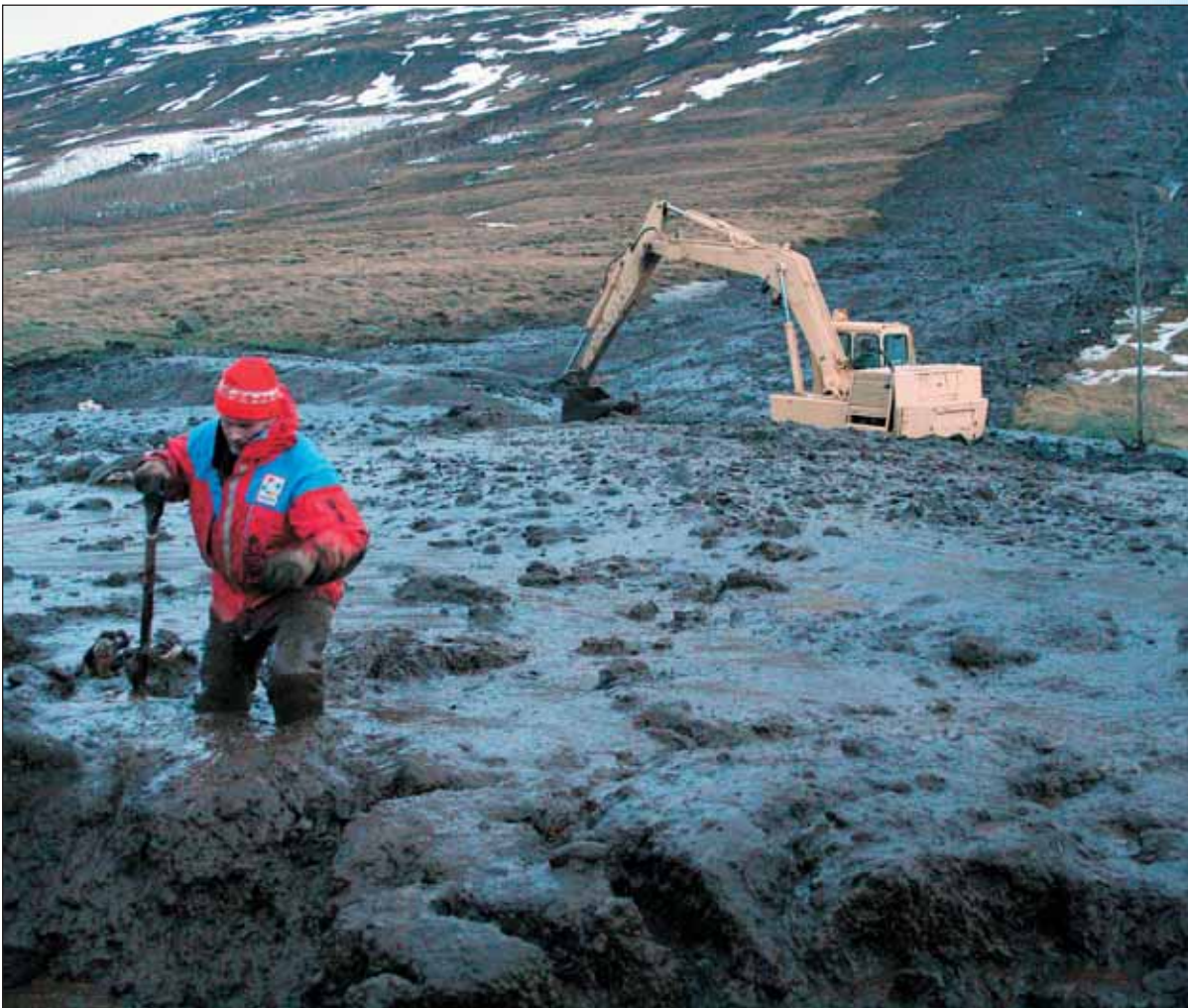
Gríðarlegt magn af aur og leðju kom úr fjallinu.