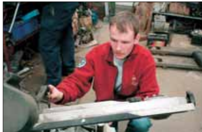
Elmar formaður smíðar í Patrolinn.

Vinnukvöld voru þó nokkur og unnu félagar mikið þar fyrir utan við smíði á nýjum bíl sveitarinnar og breytingar á þeim eldri.