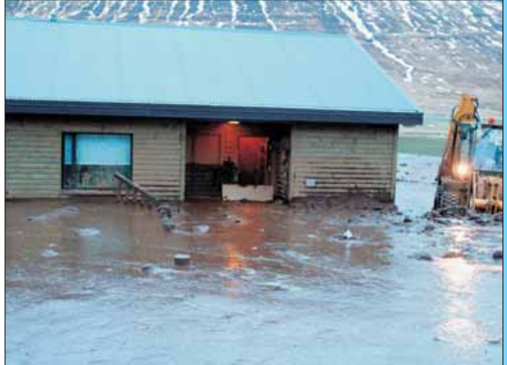
Byrjað að moka frá íbúðarhúsinu.

fjölskyldan við vinnu. Fljótlega var ákveðið að hafa sem minnstan mannskap inn á skriðusvæðinu þar sem stjórnendum aðgerða á staðnum þótti hætta á frekari skriðuföllum. Allir þeir sem unnu á hættusvæðinu voru látnir vera með snjóflóðaáyla og skráðir inn og út af svæðinu.