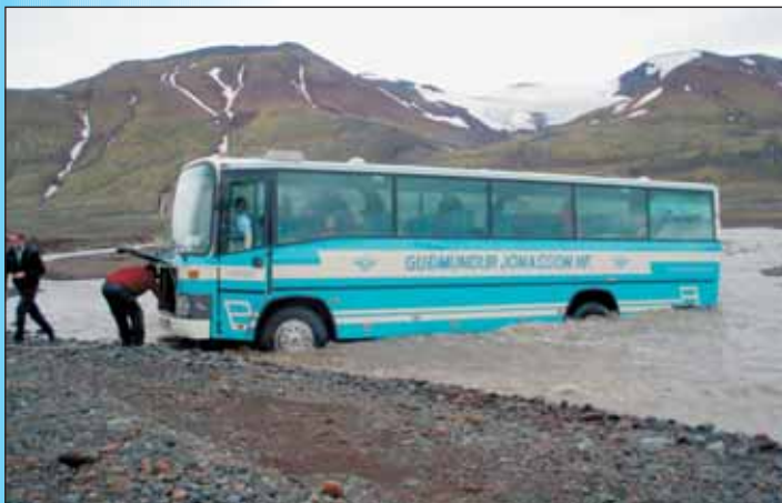
Rúta föst í Hagakvísl.