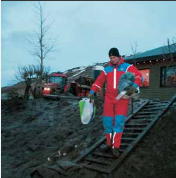
Verið að bjarga jólagjöfum og persónulegum eignum.