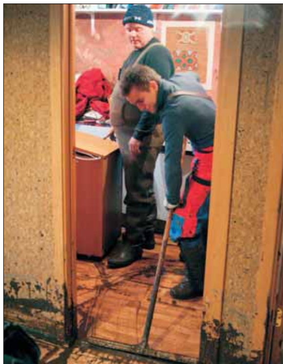
Húsið var illa farið að innan.

Hjálparsveitin lét ábúendur hafa snjóflóðaýla og mann, til að hjálpa til við fjósverkin. Um 6 leitið féll síðan önnur skriða á sama stað en mannvirki sluppu að mestu við hana. Ábúendur voru síðan ekki á jörðinni nema brýn þörf væri á en fengu þau inni á öðrum bæ í sveitinni.