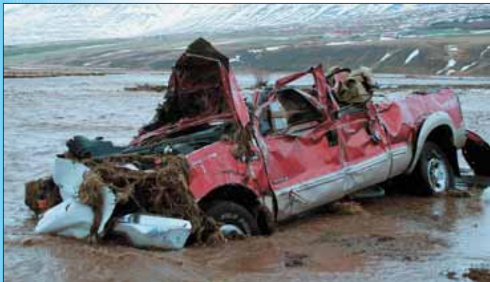
Ford f-250 sem lenti í ánni er handónýtur.