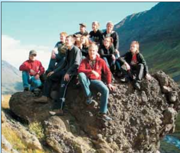
Unglिंगadeildin í fjallgöngu.