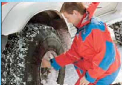
Pétur að hleypa úr.