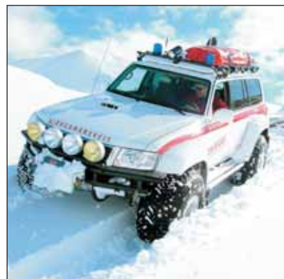
Eiður á fjöllum.

Eftir það var keyrt til Húsavíkur og þaðan haldið heim.