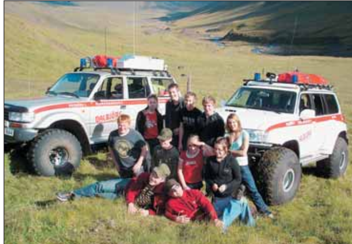
Unglिंगadeildin á Djúpadal.

Þá mættu bangsarnir á fjölskyldudag Dalbjargar sem haldinn var á Lágheiði í apríl síðastliðnum. Í ágúst var