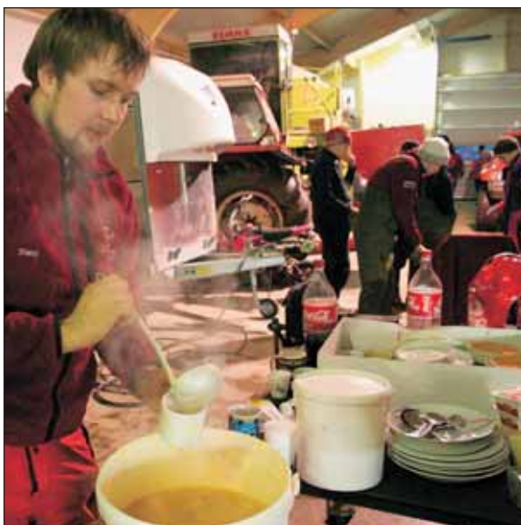
Aðgerðastöðin, biðsvæði björgunarliðs og mataraðstaða.