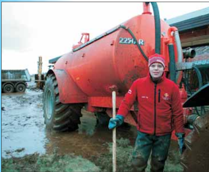
Smári og haugsugan sem var notuð innandyra.