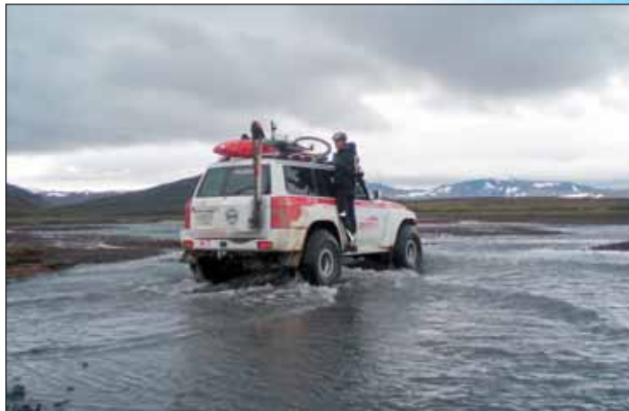
Hjólreiðarmanni hjálpað yfir á.

upp. Björgunarsveitirnar voru lagðar af stað upp Kerhólsöxl þegar mennirnir höfðu samband aftur og afþökk-uðu aðstoðina. Annað jeppagengi hafði keyrt fram á mennina og gátu haft hann upp úr krapanum.