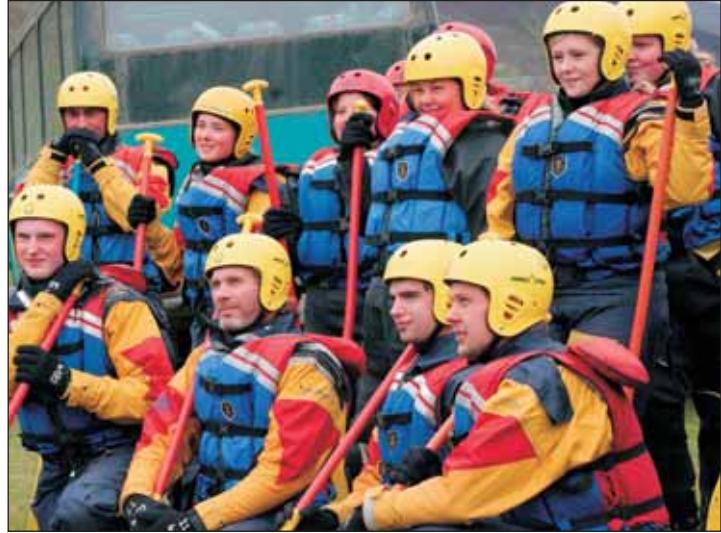
Allir klárir í bátana!