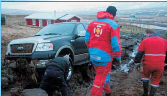
Verið að undirbúa að spila bilinn lausan.

Björgunarsveitin er kölluð til að aðstoða menn við Melbrekku. Þar hafði áin brotist niður hálsinn sitt hvoru megin við bæinn. Menn sem voru staddir þar lentu í flóðinu og reyndu að koma sér í burtu akandi en áin hreinsaði undan jeppanum og sat hann fastur. Mennina sakaði ekki og var billinn spilaður upp.