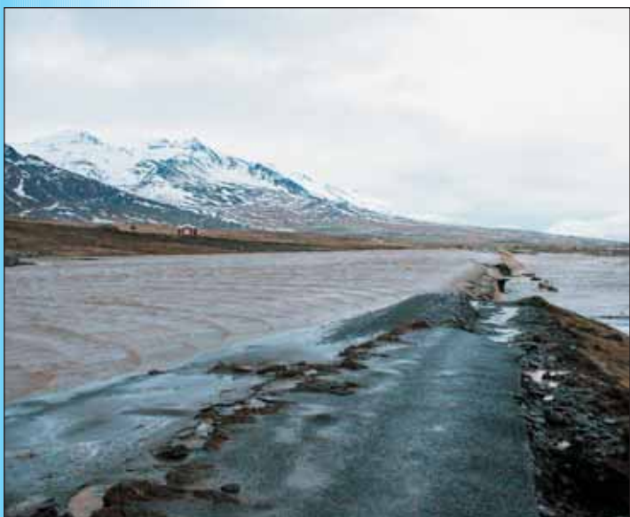
Ófært um veginn ofan við Melgerðismela.

Björgunarsveitin var beðin um að vitja ábúenda á Þormódsstöðum í Sölvadal. Farið var inn að Þormódsstöðum en ekkert amaði að hjá ábúenda. Þormódsstaðir eru á þekktu skriðusvæði.