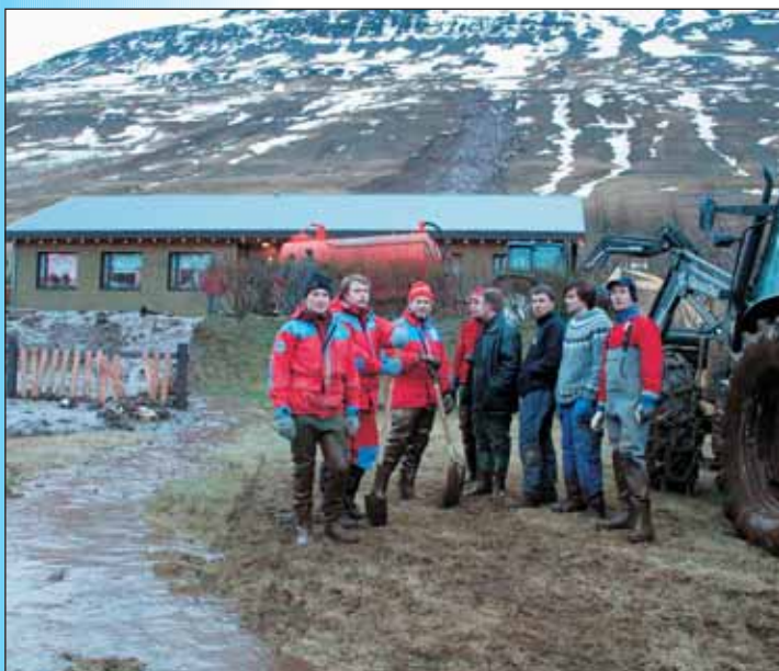
Björgunarliðið að fara yfir stöðuna.