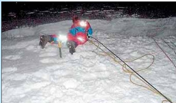
Rolf að láta klippur síga niður í sprunguna.

Tveir bílar voru þegar gerðir klárir hjá okkur með klifur- og sjúkrabúnaði ásamt 3 mönnum á hvorum bíl, var þetta sterkt lið sem fór eða tveir Slökkviliðs- og neyðarflutningamenn, einn sérhæfður skyndihjálparmaður, einn fjallabjörgunarmaður og tveir bílstjórar. Var ákveðið að við færum strax upp Kerhólsóxlina og reyndum að þræða slóðir mannanna upp að slysstaðnum en þeir höfðu farið þar upp fyrr um daginn og ekki var vitað um staðsetningu