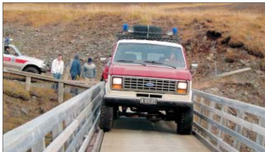
Gamli Ford á leið yfir Monikubru í Austurdal í sinni hinstu ferð.

Á árinu voru farnar nokkrar æfingaferðir hjá sleðaflokknum. Sleðarnir reynast gríðarlega vel og synd að við þurfum að endurnýja þá á næsta ári. Einnig voru nokkrir fundir haldnir og sleðarnir þrífir og yfirfarnir.