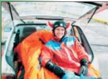
Tómas alltaf kátur...