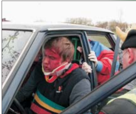
Björgunarsveitarmenn sinna sjúklingi í sviðsettu slysi.

Lagt var af stað á föstudagskvöldi frá Akureyri og komið um miðnætti til Egilsstaða þar sem gisti var í grunnskól- anum. Allir voru reknir á fætur um 5 til að fara út og byrja að leysa verkefni sem voru á víð og dreif um Hérað. Við leystum mörg skemmtileg og krefjandi verkefni, en þó hefði mátt vanda sig betur við skipulagningu í sumum at- vikum. Við skemmtum okkur samt mjög vel og enduðum daginn á sundferð og grilli. Svo var haldið aftur heim á sunnudeginum, reynslunni ríkari.