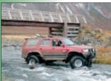
Eiður fer ekki trúðnar slóðir....