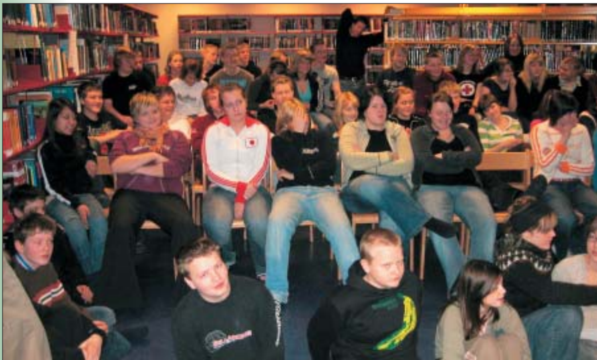
Lesið yfir unglíngunum á Hrafnagili.