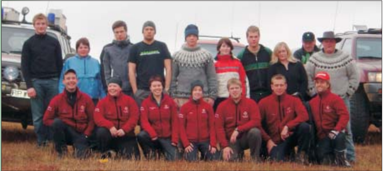
Hopurinn fyrir utan Hildarsel.