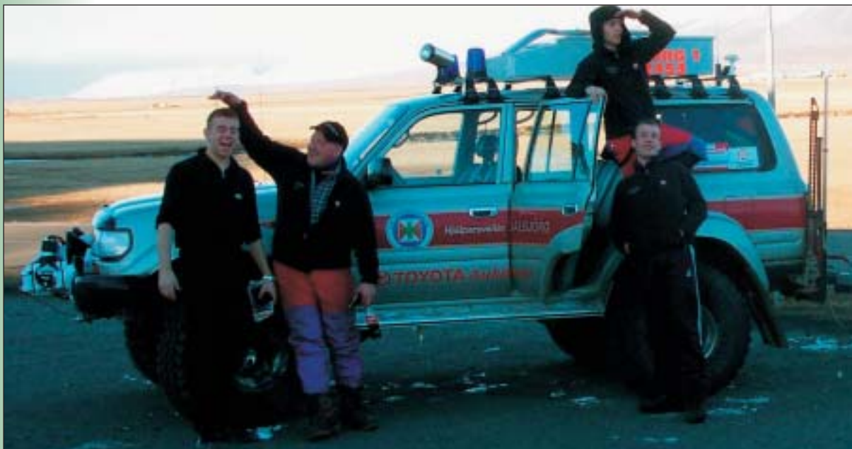
Fjórir skrítnir á leið heim úr útkalli.