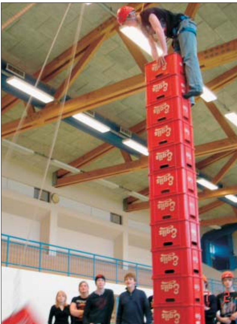
baldvin í kassaklifri