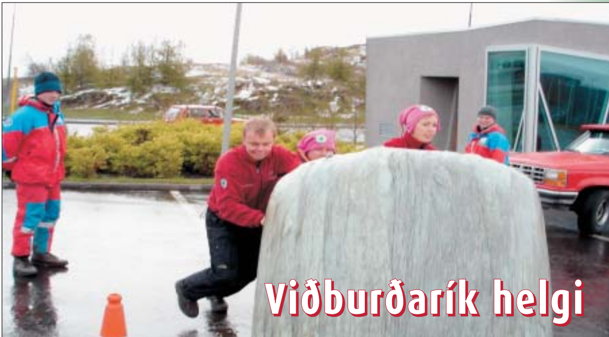
Kópavogssveitin á björgunarleikum.

Helgina 20.- 22. maí var mikið um að vera á Akureyri. Þá stóð Slysavarnarfélagið Landsbjörg fyrir fjölbreyttri dagskrá, bæði fyrir björgunarsveitarmenn og almenning. Meðal þess sem var í boði var þrautabraut Útivistarskólans, Sæbjörgin var til sýnis og sigldi með gesti um Pollinn, björgunarskip og bílar voru til sýnis og samæfing þyrlu, varðskips og björgunarskipa var á Pollinum. Einnig var brúðusýning og kassaklifur fyrir börnin. Í íþróttahöllinni var Landsþing Slysavarnarfélagsins Landsbjargar haldið og á laugardeginum voru björgunarleikarnir haldnir, en þar keppa björgunarsveitir í margs konar verkefnum. Það voru Hjálparsveitin Dalbjörg og Súlur, björgunarsveitin á Akureyri sem sáu sameiginlega um leikana og tókust þeir mjög vel. Í þetta sinn voru það sjö lið sem tóku þátt og voru þau flest af höfuðborgarsvæðinu.