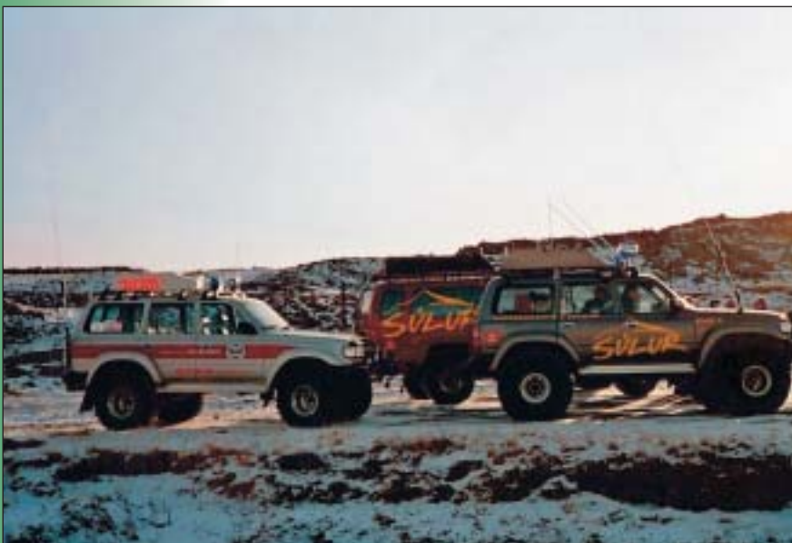
Dalbjörg og Súlur á leið í björgunarleiðangur.

Þyrla Landhelgisgæslunnar TF-LÍF fann seinni bílinn um kl. 19:30 um kvöldið. Um borð í bílnum voru þeir sem leit að hafði verið að, heilir á húfi.