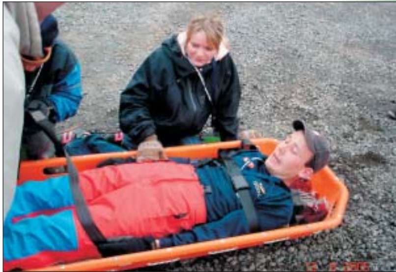
Unglingadeildin vissi hvað hún átti að gera við formanninn...!

Deildin fundar eða er með æfingar eða námskeið hálfsmánaðarlega og meðal þess sem krakkarnir hafa gert er kassaklifur, sig í Munkapver-