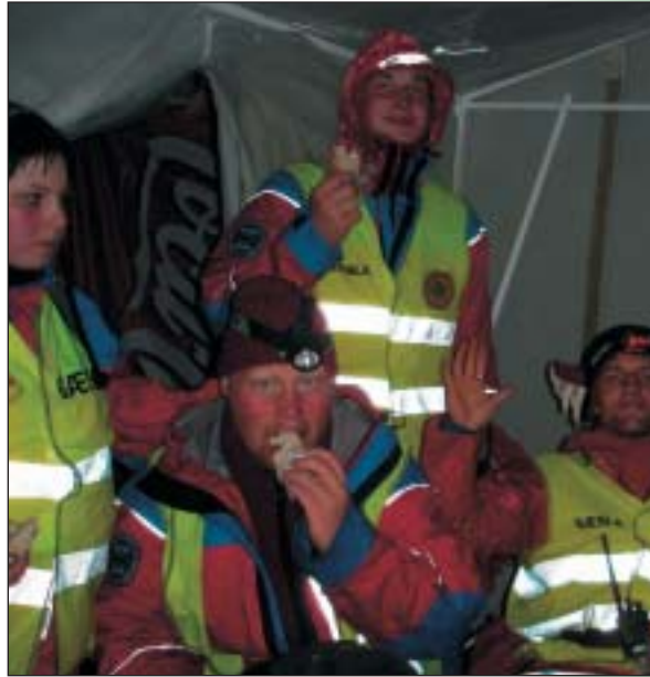
Dalbörg eldhress á þjóðhátíð!

Þess má til gamans geta að þessi einstaklingur hafði samband við okkur nokkrum vikum seinna, hafði hann náð nánast fullum bata og vildi koma sérstöku þakklæti á framfæri til Dalbjargarmanna.