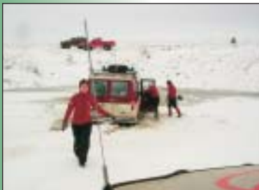
Þokkalega fastur í krapa...