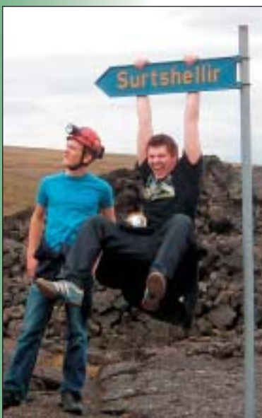
Ebbi og Grjóni alveg eðlilegir...