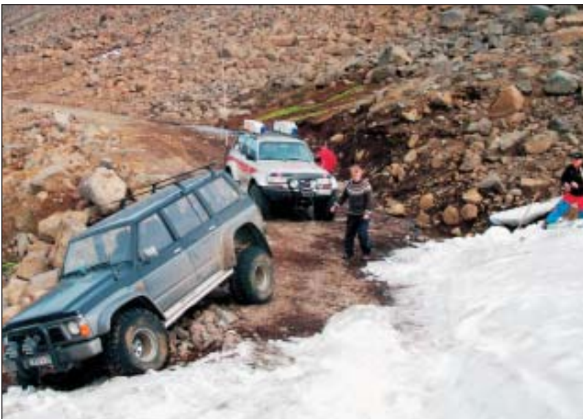
Bíl bjargað inn á Eyjafjarðardal.

ann frá sér niður bratta brekku þar sem hann endaði á grjóti. Sleðinn var óökufær efst í Kolbeinsdal við jaðar jökulsins. Fóru 8 manns og héldu á sleðanum niður í Kolbeinsdal þar sem hægt var að sækja hann á farartækjum.