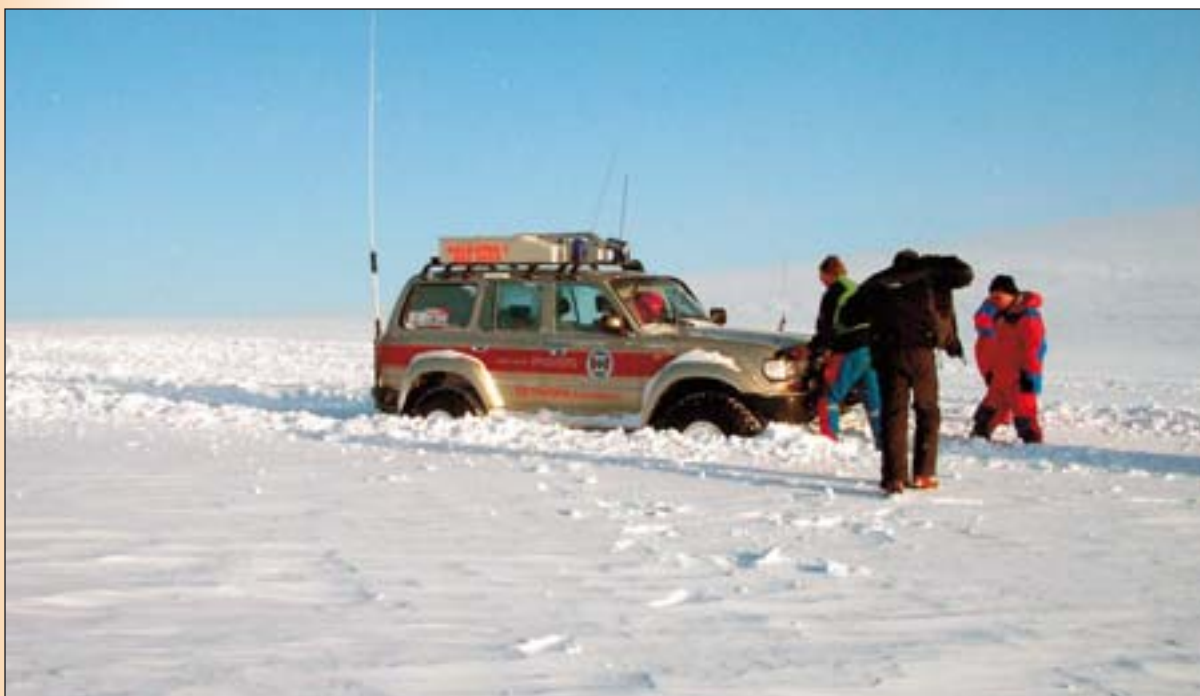
Pungfært á þorrablót og þá er ekki annað að gera en að fara út að yta...!