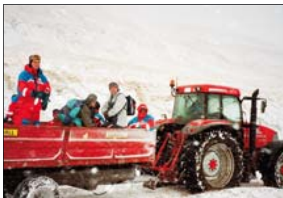
Addi í Garði með fulllestaðan vagn!

Fyrstu menn komu á slysstað um kl 23. Þar var