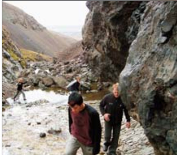
Gengið upp Bæjargilið við Húsafell.