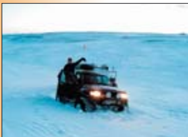
Eiður loksins fastur!