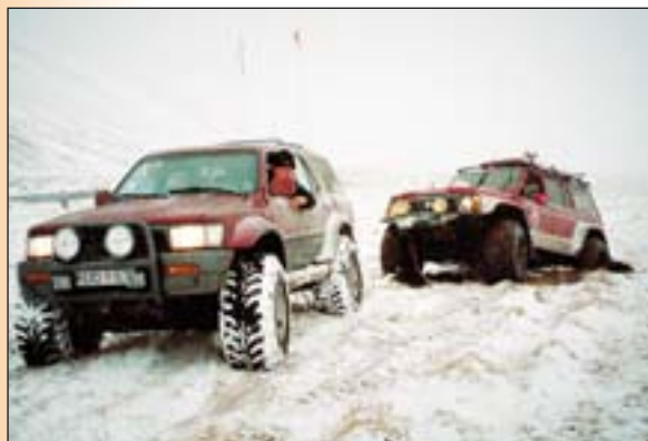
Eiður að draga bíl upp úr mýri.

snælduvitlaust veður, hvasst og skyggni einungis 2-3 metrar. Sleðamennirnir höfðu reynt að búa um sig þar til hjálp bærist en einn þeirra var þá látinn. Eftir umönnun björgunarfólks var byrjað að koma mönnum niður dalinn og að björgunartækjunum. Ferðin niður að Adda var mikil þrekaun. Þrír af þeim slösuðu gátu gengið sjálfir með aðstoð björgunarmanna, en bera þurfti einn mikið slasaðan og hinn látna. Neðst í dal-