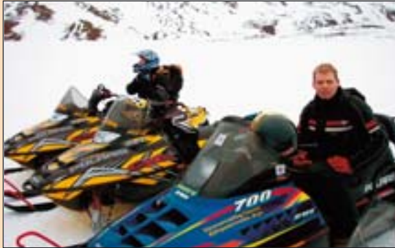
Sleðaflokkurinn í Hóls- og Bakkadal.

Tveir félagar úr Ægi mættu á sleðum og fóru með okkur upp Kaldbak og inn Grenjadal og upp á Þröskuldinn. Þar var ákveðið að fara aðeins niður í Trölladal og vestur um Þverdal og upp á Skörð sem eru við enda