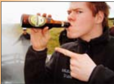
Guðjón fær kraft úr ...