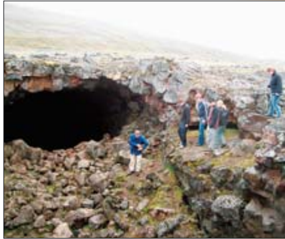
Dalbjargarmenn við Surtshelli.

Strax eftir áramót munu umsjónarmennirnir fara og kynna starf deildarinnar fyrir nemendum Hrafnagilsskóla.