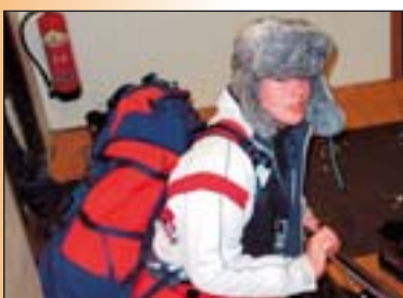
Grétar á leið á fjöll?