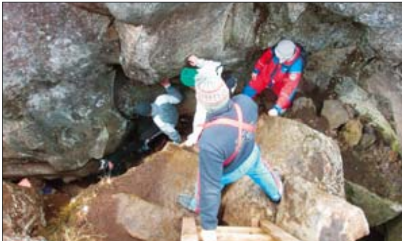
10.bekkur á leið í Vogagjá.