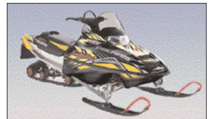
Annar af nýju sleðum Dalbjargar.

Hjálparsveitin samdi í lok nóvember um kaup á nýjum vélsleðum fyrir sveitina. Nýju sleðarnir koma til með að leysa af hólmi tvo eldri sleða sem sveitin hefur átt síðustu þrjú ár. Lögð var mikil vinna í að finna hentuga sleða fyrir okkar svæði. Niðurstaðan var að taka sleða frá Bræðrunum Ormsson, sem eru af gerðinni Polaris SwitchBack 600. Sleðarnir eru búnir 600 cc vél sem skilar 120 hestöflum og eru þeir aðeins um 220 kg þurrvigtaðir. Sleðarnir henta jafnt til langferða á hálandinu og ferða í þröngum dölum Eyjafjarðar. Þeir verða búnir staðsetningar- og fjarskiptatækjum auk annars staðlaðs björgunarbúnaðar s.s. ísexi, skóflu,