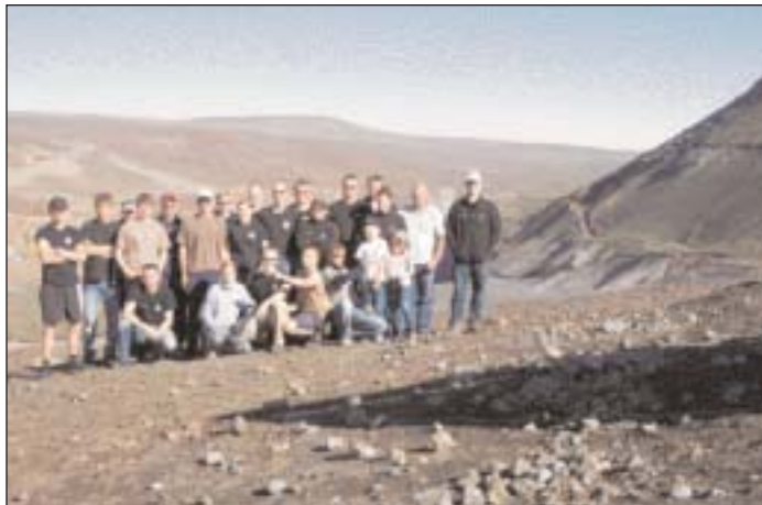
Heimsókn á virkjunarsvæðið við Kárahnjúka.