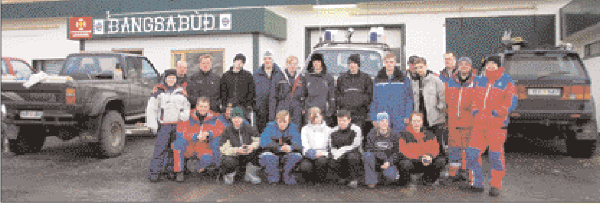
10. bekkur Hrafnagilsskóla með „bros allan hringinn“ eftir ferðina í Laugafell...!