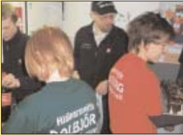
Allt á fullu fyrir afmælið...