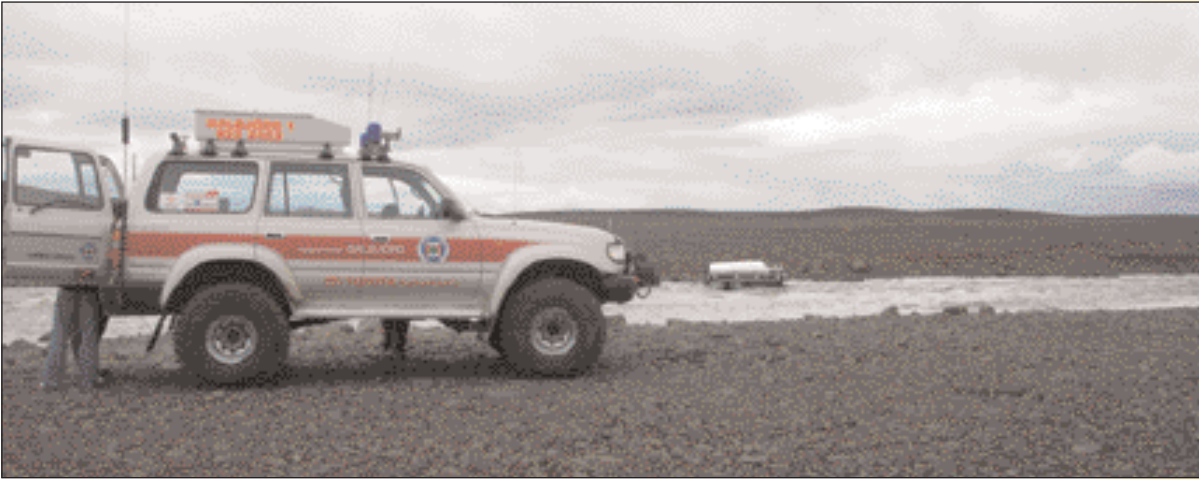
Dalbjargarmenn gera sig klára til að ná jeppa upp úr Jöklu.

Dalbjörg fékk leitarsvæði rétt hjá Húnavallaskóla, ásamt Hjálparsveitinni á Dalvík, og átta sveitirnar að fínkempa svæðin. Þegar búið var að leita í rúmar 20 mínútur var leitinni hætt, því maðurinn fannst látinn.