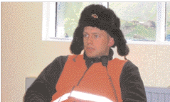
Pétur klár í slaginn á Þjóðhátíðinni í Vestmannaeyjum...

Sjö manna hópur frá hjálparseitinni fór til Vestmannaeyja, til að taka þátt í gæslu um verslunarmannahelgina.