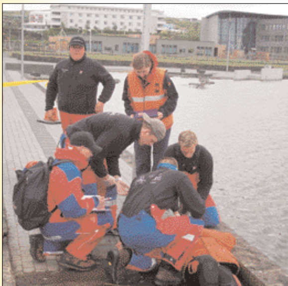
Dalbjargarmenn leysa skyndihjálparverkefni.