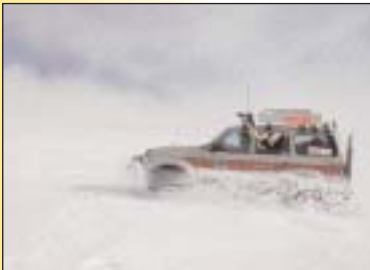
Dalbjörg 1 á fullri ferð...