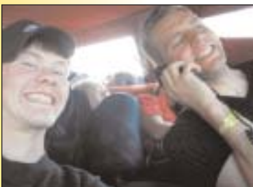
Haldið heim af þjóðhátíð...