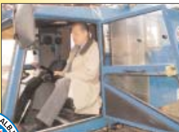
Sveitarstjórnin gekk til liðs við sveitina...