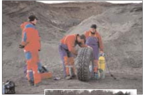
Verkefni á landsæfingu í mars sl.