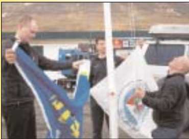
Hvernig virkar þetta???