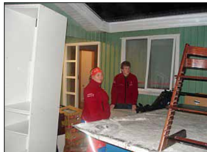
Verðmætabjörgun í Hrafnagilshverfi.

Björgunarsveitir við Eyjafjörð voru kallaðar út þennan dag vegna slasaðs vélsleðamanns á Flateyjardal. Dalbjörg var kölluð út kl. 16:30 og sendi þrjú menn á sleðum og báða jeppana með sex