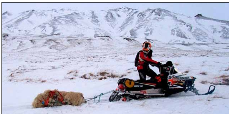
Kindum komið til byggða.

Verkefnum vegna veðursins var sinnt áfram þennan dag, fólki var komið til síns heima og einnig var viðgerðar- mönnum Símans komið fram í Sámsstaði vegna bilunar á Tetrakerfinu.