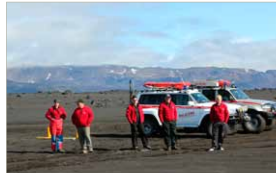
Félagar í hálendisgæslu.