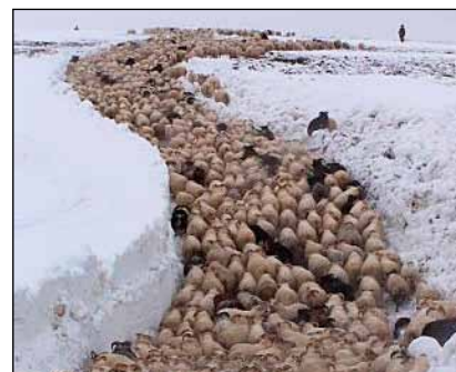
Rekstur á Þeistareykjasvæðinu.