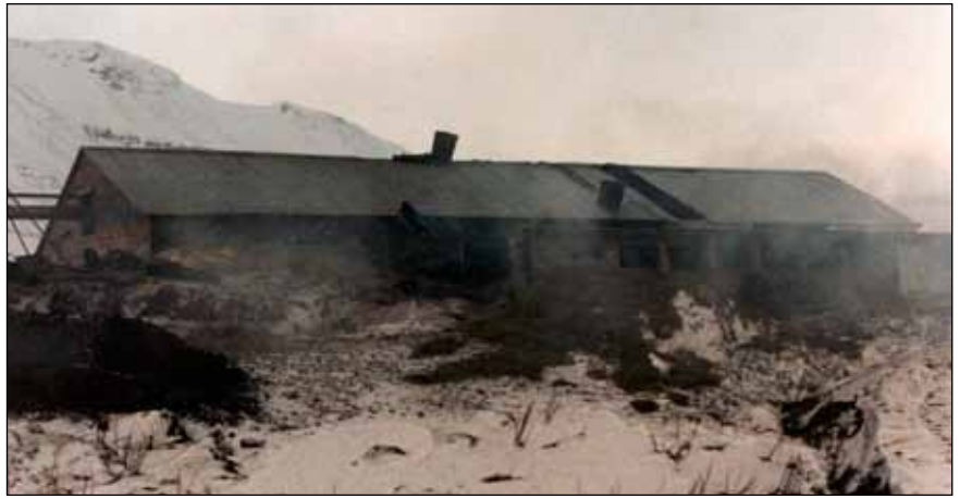
Heila húsið er hlaðan á Tjörnum. Við hliðina eru fjósin tvö sem brunnu, eins og sjá má, og hinum megin við hlöðuna má greina fjárhús, þaðan sem tókst að bjarga 260 kindum.

konur af nágrannabæjunum sem höfðu til mat og kaffi handa þeim sem voru við vinnu á staðnum. Ég sé það í gamalli dagbók að ég hef komið heim í fjós á jóladagsmorgun og farið svo fram á Tjarnir aftur og ekki komið heim fyrr en í fjósverkin á jóladagskvöld.