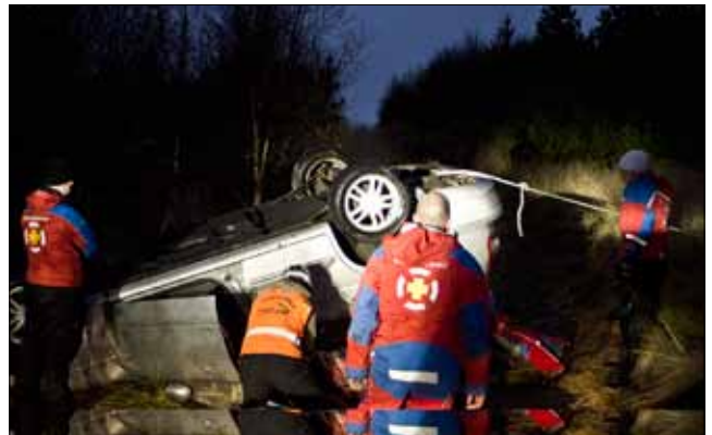
Unnið að björgun úr bílveltu.