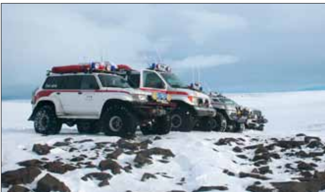
Týr og Súlu í æfingarferð um Kerhólsöxl.