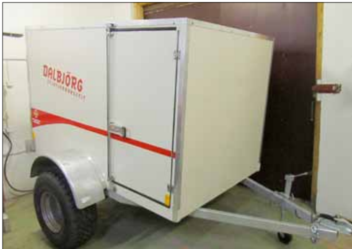
Nýja hópslysakerran okkar.