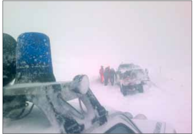
Mikið mæddi á björgunarsveitinni á haustmánuðum.