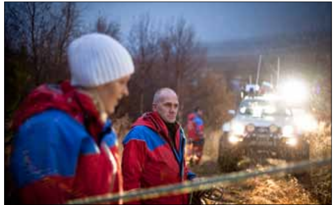
Félagar Dalbjargar og Súlna.