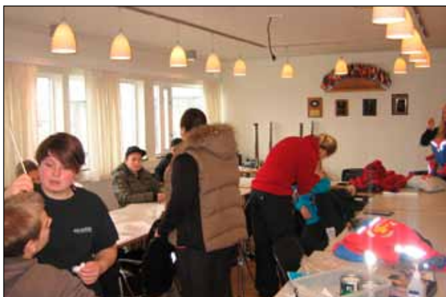
Undirbúningur og förðun sjúklinga fyrir samæfingu í október.

unum í unglingsdeildinni á Dalvík og hópunum var skipt niður á stöðvar þar sem voru fjölbreytt og skemmtileg verkefni. Við fórum í stutta jeppaferð í hlíðum Böggvisstaðafjalls, prófuðum sig í skemmum þeirra, fórum á slöngubát, böruburðarkeppni og fleira. Flestir töluðu um að skemmtilegast var að prófa slöngubát en líklega er það vegna þess að það var nýtt fyrir okkur.