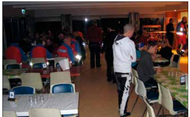
Litið yfir matsalinn að lokinni æfingu.