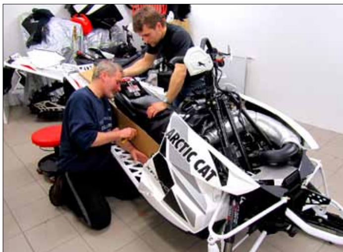
Verið að setja GPS-tæki í nýja sleðann.

Á sleðana voru einnig keypt ný GPS tæki svo þeir verða vel tækjum búnir þegar til kastanna kemur.