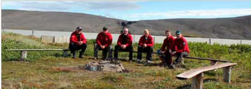
Félagar að njóta veðurblíðunnar í hálendisgæslu í sumar.

á ári til að tryggja rekstur hennar. Á móti skuldbindur hjálparsevitin sig til að sinna öflugum björgunarhlutverki, unglingastarfi auk ákveðinna verkefna fyrir sveitarfélagið. Samningurinn markar tímamót fyrir okkur og felst í honum mikil viðurkenning á starfi sveitarinnar.