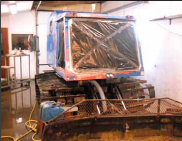
Bangsi í undirbúningi.