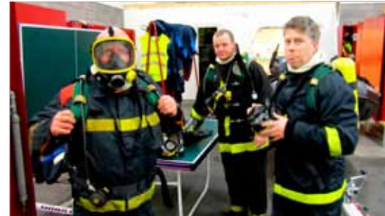
Hjálparliðið á æfingu.