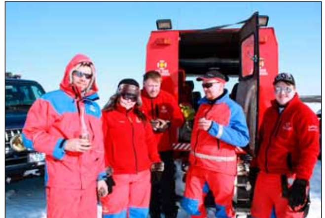
Góður hópur við Bangsa.