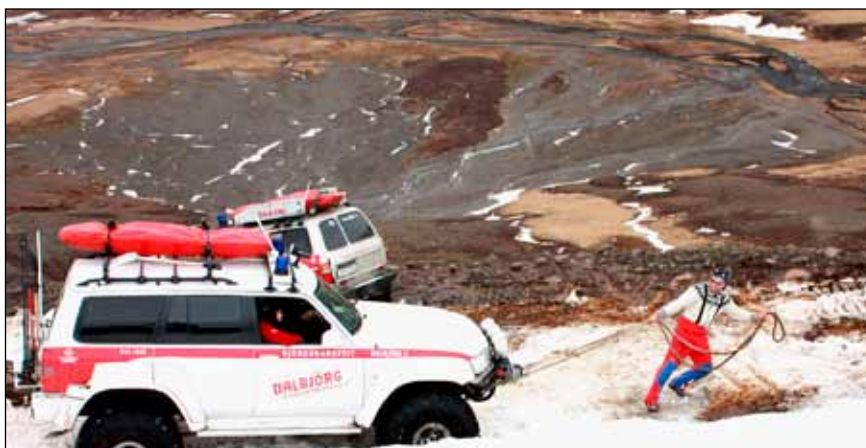
Stundum þarf að draga bílana...