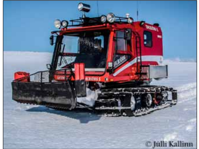
Bangsi orðinn glæsilegur!

Margt hefur gerst í tækjamálum hjá Dalbjörg í ár og verður hér tiplað á helstu þáttum.