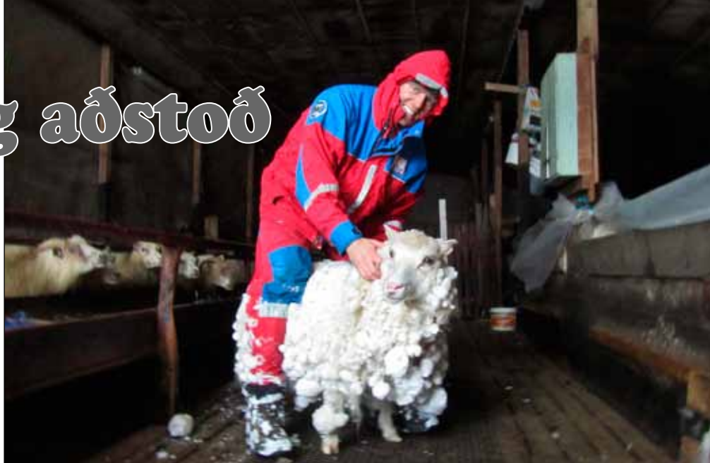
Kindum bjargað í hús í einu útkallanna í september.

Hjálparveitin Dalbjörg og Súlur, björgunarsveitin á Akureyri voru kallaðar út rétt fyrir kl. 11 vegna slasaðs göngumanns á hálendinu, en talið var að hann væri úlnliðsbrotinn. Tveir bílar frá Dal-