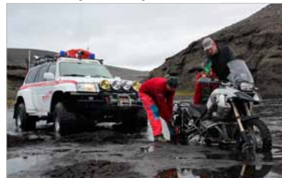
Málum bjargað í hálendisgæslunni í sumar...