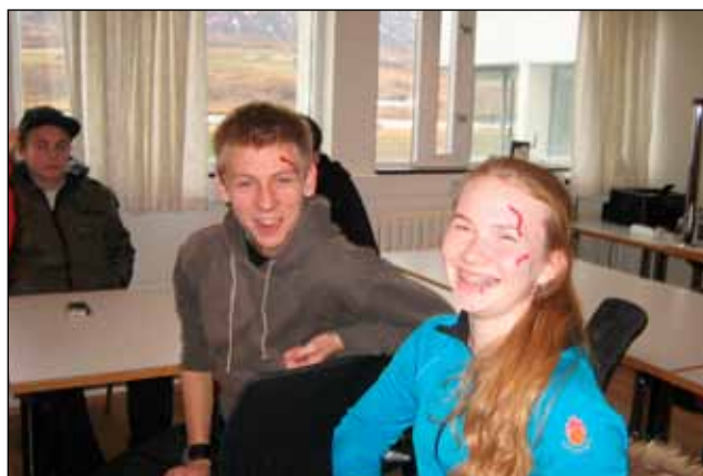
Fjör við undirbúning samæfingar.

Í kjölfarið voru fundir mánaðarlega og á þeim var okkur t.d. kennt á áttavita, að lesa kort og hvernig leita á að manneskju. Það sem okkur finnst vera eftirminnlegast er þegar við heim-sóttum unglingsdeildina Dasar á Dalvík, en um tólf krakkar fóru með í þá ferð. Þar var okkur boðið að vera með í þeirra starfi eina kvöldstund. Okkur var skipt niður í hópa með krökk-