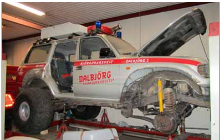
Það eru bún að vera mörg handtök síðan í sumar

Það var eftir snjóaveturinn 1995 sem upp komu umræður innan Hjálparveitarinnar Dalbjargar að sveitin þyrfti að eignast annan bíl, nánar tiltekið jeppa. Fyrir átti sveitin Ford Econoliner, sem sveitin eignaðist 1988. Þennan mikla snjóavetur 1995 kom í ljós að Fordinn virkaði ekki sem skyldi í snjó sökum þyngdar sinnar á móti dekkjastærð og varð það kveikjan að umræðum um jeppakaup. Miklar vangaveltur hófust um hvernig jeppa skyldi kaupa og hvaða tegund. Smám saman þróuðust hugmyndirnar og sumarið 1996 stóð valið á milli Musso eða Toyota. Þá upphófst mikil vinna í alls konar tilboðagerð sem gekk á milli okkar og bílaumboðanna.