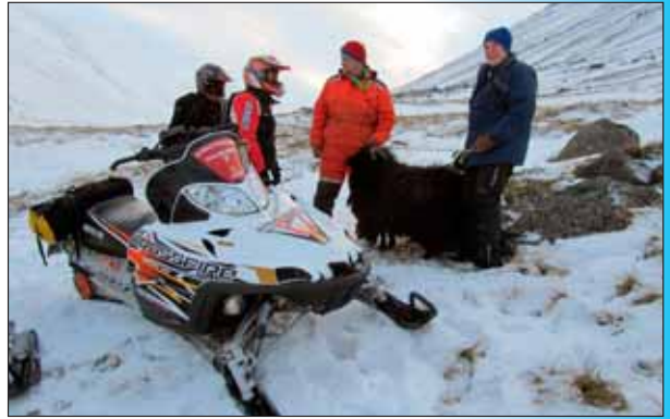
Meðal verkefna sleðaflokks var að leita að kindum

Sleðaflokkurinn er mjög virkur yfir vetrarmánuðina og