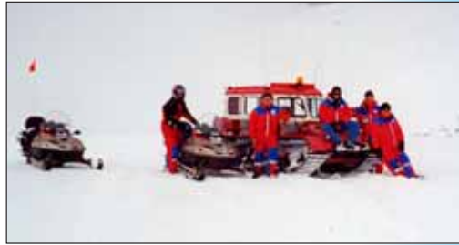
Sleða- og snjóbílaflokkur að leggja í hann upp Kerhólsóxl

léleg og þurfti því að beita sköfunni mikið inn á rúður. Í Nýjadal hittum við fyrir aðra snjóbíla, tvo yfirbyggða troðara og Snow Cat Súlumanna. Éli gamli var frekar rýr miðað við þessa stóru trukka og þóttumst við sjá á mannskapnum að fólki myndist við afdalalegir og skrítnir að hafa komið á þessu apparati. Við létum það ekki á okkur fá heldur reyndum að bera okkur vel og þóttumst geta flest það sem hinir gátu, vorum meira segja með bakkflautu, þótt mannleg væri! Snjóbílaflokkur var ræstur af stað í dagstúr um svæðið og halda átti í Gæsavötn, í Vonarskarð, yfir Tungnafellsjökul og aftur í Jökuldal í kvöldmat. Éli var alls enginn eftirbátur hinna, því við gátum keyrt töluvert hraðar en hinir og þótti okkur það ekki leiðinlegt. Þegar við komum í Gæsavötn, að sjálfsögðu nokkuð á undan hinum snjóbílunum, hittum við fyrir sleðaflokkinn en þeir biðu komu snjóbílaflokks. Þótti mönnum lítið til snjóbílaflokks koma þegar 4 sveitamaðn ruddust út úr þessu litla krili og buðu góðan daginn. Ekki vorum við eins borubrattir þegar við lögðum af stað upp