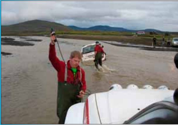
Bíll dreginn upp úr Nýjadalsá í sumar