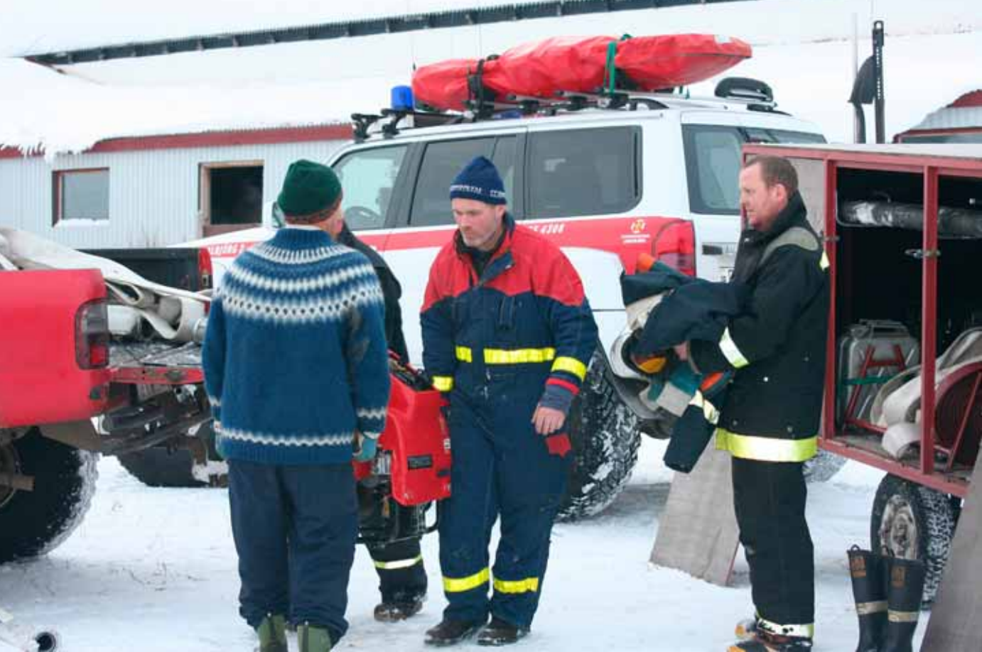
Hjálparliðsmenn að ganga frá búnaði