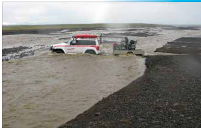
Það þurfti víða að aðstoða menn yfir ár á hálendinu