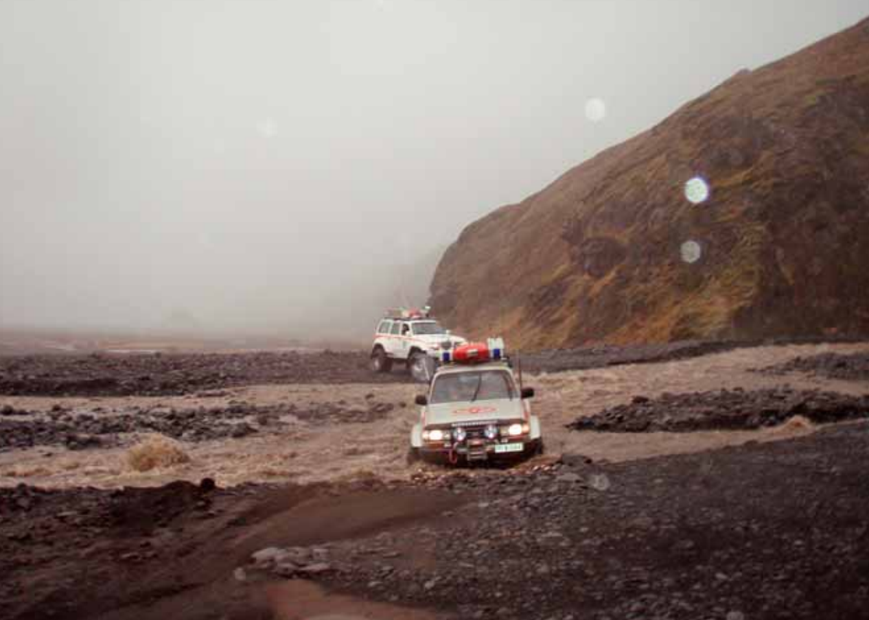
Á ferð um gossvæðið við Eyjafjallajökul