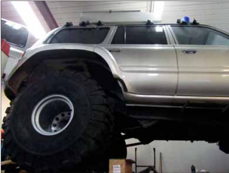
Búið að breyta bílnum fyrir 46" og nýju Pitbull-dekkin komin undir hann

okkur einstaklega vel með litlu viðhaldi. Árið 2005 var framhásing endurnýjuð og vorið 2010 var ákveðið að fara í miklar endurbætur á bílnum sem hófust nú