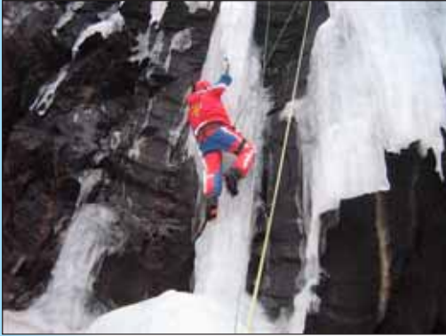
Fjallamennskunámskeið í janúar

Björgunarsveitin Týr er starfrækt á Svalbarðsströnd. Hún sinnir almennum björgunarsveitarstörfum og er útbúin tveimur bílum.