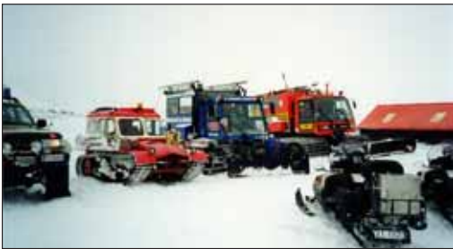
Lítill og lúinn miðað við hina bílana

Í þessari ferð kviknaði óskýranleg fjallaþrá hjá okkur bræðrum og hefur ekkert lát verið á vetrarferðum allskonar síðan.