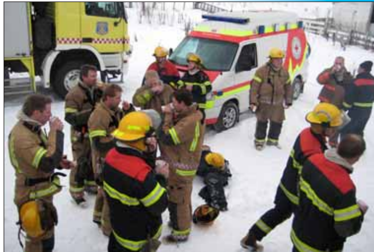
Hluti slökkviliðsmanna sem tóku þátt í æfingunum