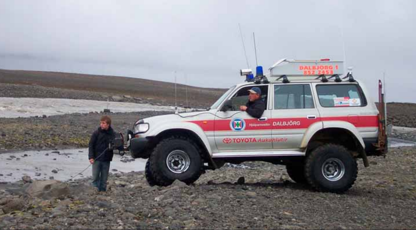
Dalbjörg 1 eins og hann leit út fyrir 6 árum