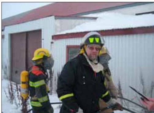
Ólafur að aðstoða reykkafara

Æfingin var sett þannig upp að Hjálparliði Dalbjargar og Slökkviliði Akureyrar barst útkall í gegnum Neyðarlínuna þar sem tilkynnt var um eld í útihúsum á Torfufelli og að tveir menn hefðu farið inn til að bjarga skepnum. Varðstjóri SA lét tengja saman Tetra rás slökkviliðs og útkallsrás Dalbjargar þannig að þegar Hjálparliðið fór úr húsi kölluðu þeir sig inn og gátu átt samskipti við SA og