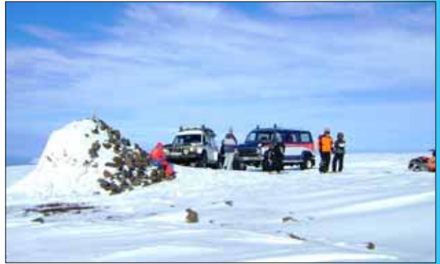
Við Menntaskólavörðuna uppi á Vaðlaheiðinni

Hjálparsveitin Dalbjörg var með fjölskyldudag í Víkurskarði í apríl og buðu okkur að vera með. Mikið fjör var hjá ungum sem öldnum og voru þarna sleðar, þotur, fjórhjól og jeppar sem hægt var að leika sér á. Grillið var á sínum stað og gátu allir sem vildu nýtt sér grillaðstöðuna og nært kroppinn. Æskudagurinn var haldinn hér á Svalbarðseyri og stóðum við fyrir kassaklifri í rjómaþíðu, en smá golu, sem gat sett strik í reikninginn og olli stundum falli. Sá sem fór hæst fór 22 kassa og tók nýji sveita-