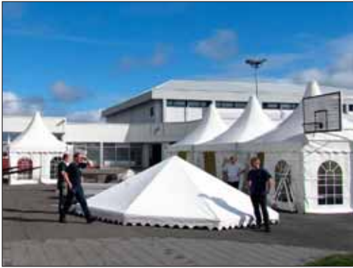
Unnið við að koma upp tjöldum fyrir Handverkshátíð

þennan viðburð, en það var alveg ómetanlegt. Jólafélagið skilaði keflinu svo til nýrra aðila, sem liggja vonandi ekki á liði sínu á næsta ári!