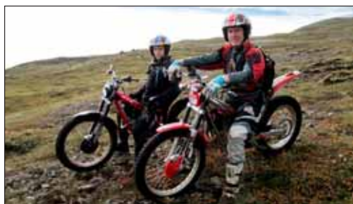
Tveir félagar í leit að kindum í haust

Í Dalbjörg eru nokkrir björgunarsveitarmenn sem eiga hjól, bæði torfæruhjól og fjórhjól, og hafa þeir mikla reynslu af þeim auk þess að hafa aflað sér talsverðrar staðkunnáttu á svæðinu á ferðum sínum. Þeir hafa undanfarin ár farið í nokkur útköll, bæði í leit og sem fyrsta viðbragð í slysum. Hjálparsevitin hefur nú ákveðið að stofna hjólaflokk innan sveitarinnar og kynna þennan möguleika fyrir öðrum björgunaraðilum.