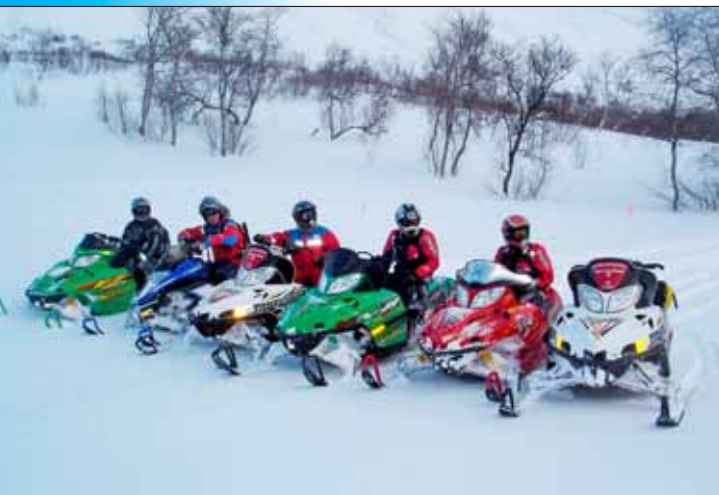
Sleðadeildin í æfingarferð

Þrjú félagar frá Dalbjörg fóru til Reykjavíkur á sleðamessu í vetur, sem er árleg ráðstefna fyrir sleðahópa björgunarsveita. Á sleðamessunni í ár, sem var haldin í húsnæði