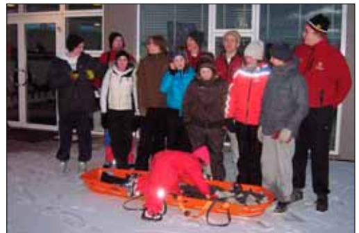
Unglingadeildin fyrir utan skólann eftir 14 km göngu

Í haust barst einnig beiðni um að aðstoða tvo bíla sem höfðu lent útaf í Víkurskarðinu, en mikil hálka var og skafrenningur. Þegar komið var á staðinn voru bílarnir mannsaurir og því lítið annað að gera en snúa aftur heim.